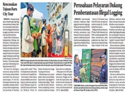
Gambar 6 Hasil Press Release Media Konvensional

Berikut gambar dibawah merupakan hasil tahapan publikasi melalui media konvensional dan media online. Pembuatan content writing atau press relaease dikerjakan dengan menggunakan konsep dasar 5W 1H dan menghasilkan penyampaian yang jelas mulai dari apa, siapa, kapan, mangapa, dimana dan bagaimana. Pembuatan tersebut tidak mudah dilakukan oleh seorang humas, pengerjaan CSR sendiri dilakukan dengan kejadian yang benar-benar terjadi dan melibatkan seorang humas.