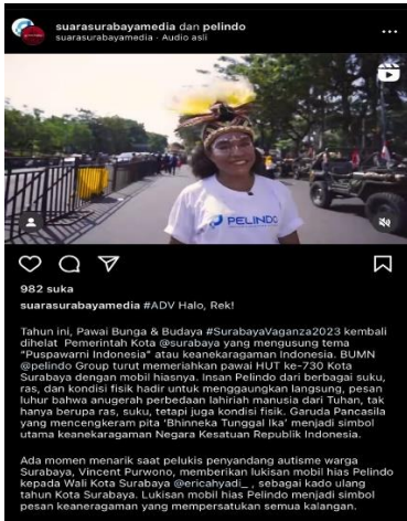
Gambar 4 Content Writing CSR Instagram

Pembuatan content writing ini sangat rentan dilakukan mulai dari cara penyampaian kata ketika proses pengetikan, kata yang baik dan baku menjadi kunci humas agar pembaca dapat mudah memahami dan mengingat dari berita yang di baca. Kewajiban bagi humas Pelindo Sub Regional Jawas dalam pembuatan proses content writing dan press release guna di publikasikan di media konvensional, blog , web , dan media cetak. Pembuatan