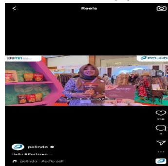
Gambar 10 Kegiatan CSR

Pelindo Sub Regional Jawa dalam proses publikasi setiap kontennya melihat keadaan di sekitar dengan mengikuti konten yang sedang viral sehingga menjadi salah satu media dalam memberikan konten guna para pengguna instagram dan penikmat konten Pelindo Sub Regional Jawa. Dengan adanya instagram Pelindo Sub Regional Jawa memaparkan kegiatan CSR secara mudah dengan berbagai konsep kegiatan dan editing yang maksimal kemudian proses publikasi melalui video reels komersial di uploud secara konsisten setiap kegiatannya yang perusahaan dapat mengenai CSR. Media sosial instagram mudah memahami maksud dan tujuan yang disampaikan oleh perusahaan mengenai gambaran kegiatan, video kegiatan dan content writingnya .