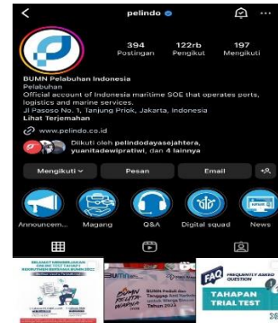
Gambar 8 Media Sosial Instagram

Hal ini sudah menjadi konsekuensi logis bagi seluruh perusahaan-perusahaan besar khususnya Pelindo Sub Regional Jawa. Masyarakat hanya menilai citra perusahaan melalui kegiatan CSR yang setiap perusahaan lakukan seperti masyarakat lokal sekitar Pelindo Sub Regional Jawa. Media sosial merupakan media utama guna sebuah branding perusahaan yang mempunyai orientasi konsumen (Sudirman, 2021).