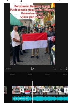
Gambar 3 Editing video dan foto

Strategy push merupakan awalan yang mendahului strategy pull , strategy pull sendiri dimana skill humas khususnya pubdok dalam melakukan editing akan di lakukan oleh Humas Pelindo Sub Regional Jawa karena pengaruh besar terjadi ketika hasil dari gambar yang telah di publikasikan menjadi nilai yang bagus guna setiap kegiatan yang di lakukan Pelindo Sub Regional Jawa khususnya foto dan video menjadi hal utama guna di publikasikan. Hasil gambar yang telah di dapat akan melewati tahap editing dengan baik dan nilai editing akan mempunyai pengaruh besar dalam penarikan likes dan viewers (Dzulqarnain, Faqih & Nazir, 2021).