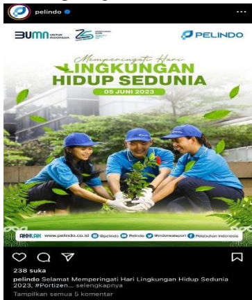
Gambar 7 Penanaman Pohon Mangrove

Bina lingkungan yang dilakukan oleh Pelindo Sub Regional Jawa sering dilakukan guna guna mencegah banjir dan menjaga kelestarian lingkungan di sekitar laut, hal ini di lakukan seperti gambar dibawah :