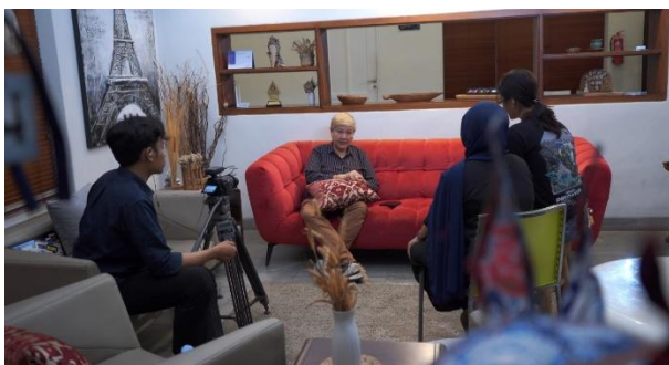
Gambar 2. BTS Shooting Narasumber