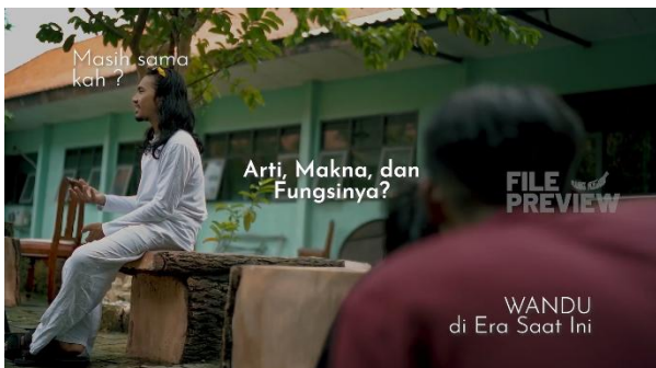
Gambar 1. Cuplikan Film Babak 2

produksi berjalan sesuai perencanaan, meliputi koordinasi narasumber, persiapan peralatan teknis, dan kesiapan kru sebelum proses shooting dimulai. Pada film dokumenter Panggung Wandu proses pengambilan gambar dilakukan dalam enam kali produksi, mencakup berbagai lokasi di Sidoarjo, Surabaya, Gresik, Mojokerto, dan Krian. Terdapat beberapa hal penting yang harus produser catat. Paling penting adalah konsistensi alur cerita menjadi prioritas utama, setiap sesi pengambilan gambar harus tetap mengacu pada treatment yang telah disusun agar tidak ada footage yang keluar dari konteks narasi. Kedua, pengelolaan waktu produksi secara efektif menjadi tanggung jawab yang tidak bisa diabaikan. Ketiga, manajemen anggaran peralatan teknis perlu diawasi secara ketat di setiap sesi produksi agar pengeluaran tetap terkendali dan tidak melampaui rencana awal.