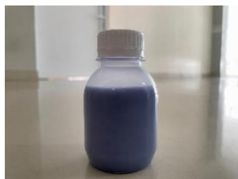
Gambar 1. Produk Terbaik

Hasil penilaian menunjukkan bahwa F1 memperoleh nilai tertinggi sebesar 5,53 dengan kategori agak suka, diikuti F2 sebesar 5,00 dengan kategori agak suka. Sementara itu, F3 memperoleh nilai terendah sebesar 3,87 dengan kategori agak tidak suka. Berdasarkan hasil tersebut, F1 menjadi formulasi yang paling diterima panelis sehingga dipilih untuk analisis aktivitas antioksidan.