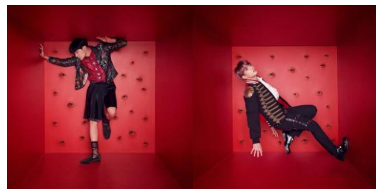
Gambar 12. Foto individu (dari kiri ke kanan) J-Hope dan Jungkook.

Mata adalah simbol dari penghakiman dan wewenang, serta penghormatan dan kesopanan. Dalam The Archetypes and the Collective Unconscious (Jung, 1997) sang penulis mengatakan bahwa mata adalah simbol asli dari wanita dimana pupil adalah sang ‘anak’, tempat dimana cinta dimulai. Sebagai properti foto konsep, replika-replika mata ini terlihat berkerumun di satu sisi dinding, mengintai dari belakang punggung kedua anggota grup.