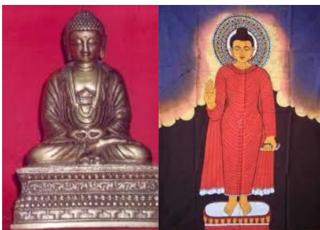
Gambar 14 . Beberapa contoh dari gestur tangan mudra (Sumber: web.stanford.edu)

Properti yang terakhir adalah tangan. Tangan memiliki sangat berbagai makna yang bervariasi, tergantung dari kepercayaan kebudayaan mana yang hendak diambil. Namun demikian, pemaknaan yang paling umum terhadap tangan adalah perannya sebagai alat komunikasi suci pada ajaran agama Buddha yang disebut juga sebagai mudra . Gestur-gestur tangan ini melambangkan manifestasi surgawi seperti kasih sayang, kesabaran, dan keberanian (Kumar, 2000)