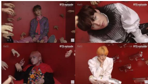
Gambar 7. Detail kostum anggota BTS (dari kiri ke kanan) Jimin, Suga, V, dan Jin

Dalam foto konsep Love Yourself: Answer versi S, kostum bertema New Romantic yang para anggota kenakan memiliki kesamaan visual namun juga secara gamblang memiliki elemen tekstil yang berbeda satu sama lain. Keseluruhan kostum memiliki point of interest berupa detail mencolok pada garmen seperti celana berwarna merah muda yang dikenakan Jimin, kerah berenda hitam pada atasan milik Suga, blouse floral 3 dimensi pada setelan V, dan sepatu perak pada kostum Jin.