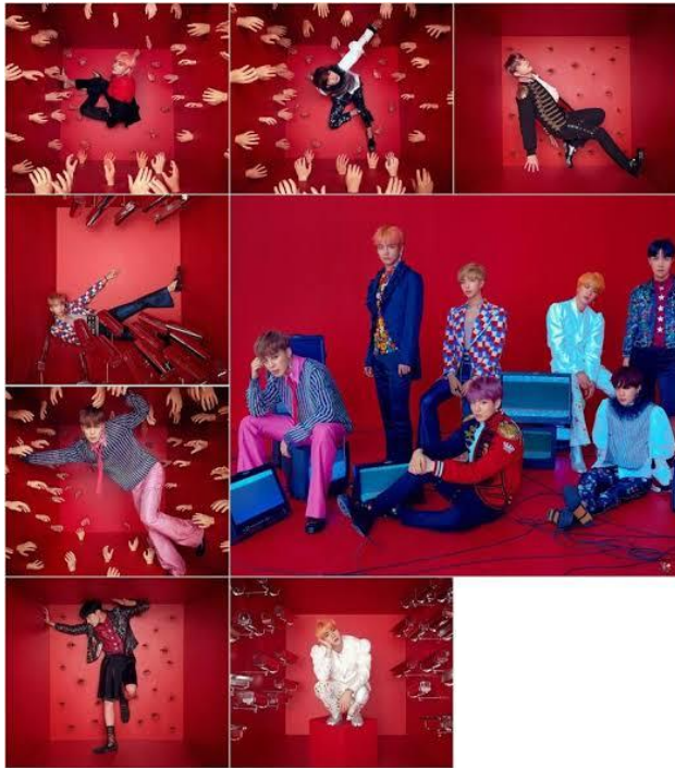
Gambar 2 . Kolase 8 foto konsep album Love Yourself: Answer Versi S