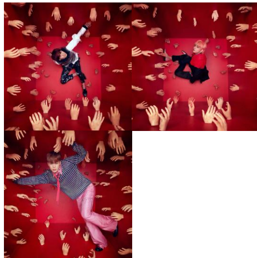
Gambar 15 . Foto individu (dari kiri ke kanan) Suga, V, dan Jimin

penanda dari manifestasi surgawi ini malah menjadi kumpulan objek yang mengerumuni kelima sisi kotak merah. Pada foto konsep Suga dan V, kerumunan replika tangan tersebut terlihat mencuat dari kelima sisi kotak, sehingga memaksa mereka untuk tetap tinggal terduduk di dasar. Hal yang sama juga dapat diperhatikan pada foto konsep Jimin, namun, berbeda dengan kedua anggota lainnya, Jimin terlihat berusaha keluar dari kotak dan berdiri secara diagonal di salah satu sudut untuk menghindari replika-replika disekitarnya.