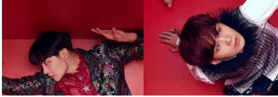
Gambar 10 . Ekspresi J-Hope (kiri) dan Suga (kanan) pada foto individu

latar di sekitar mereka seolah dengan antisipasi, cemas akan apa yang mengerumuni mereka.