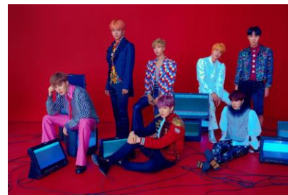
Gambar 9 . Ekspresi anggota BTS pada foto kelompok