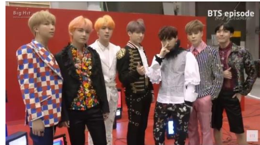
Gambar 5 . Close up kostum anggota BTS