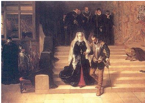
Gambar 4 . Ilustrasi eksekusi Mary Stuart, Ratu Skotlandia

martir dalam ajaran Gereja Katolik (Poulet, 2008).