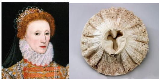
Gambar 8 . Potret lukisan Ratu Elizabeth I (kiri) dengan kerah ruff (kanan).

Detail-detail pakaian yang mereka kenakan ini bukan merupakan aksesoris yang umum digunakan dalam pakaian sehari-hari laki-laki. Sebagai contoh, kerah berenda yang digunakan Suga adalah garmen yang terinspirasi dari ruff , atau kerah pada gaun yang digunakan oleh bangsawan-bangsawan wanita Eropa di pertengahan abad ke-16.