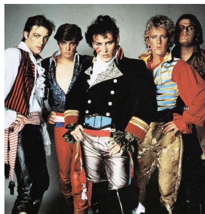
Gambar 6 . Adam and the Ants, salah satu grup musik rock asal Inggris yang menggunakan konsep New Romantic .

Ketujuh anggota BTS mengenakan kostum bertema New Romantic . New Romantic merupakan gerakan budaya populer yang muncul di Inggris pada akhir tahun ‘70an. (Johnson, 2009). New Romantic memiliki gaya fashion yang terkesan flamboyan dan meriah, berupa pakaian dalam bentuk setelan dengan detail-detail mencolok seperti kerah berenda dan jaket bertabur manik-manik.