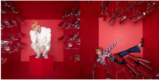
Gambar 13 . Foto individu (dari kiri ke kanan) Jin dan RM.

Dalam pemaknaan foto konsep Jin dan RM, sekumpulan replika kamera CCTV merupakan metafora dari media dan orang-orang di dalam industri hiburan yang selalu mengawasi BTS dari dekat, secara spesifik orang-orang dibalik kamera ini adalah media. Pihak media baik internasional maupun nasional selalu menunggu saat dimana BTS membuat kesalahan tanpa mempedulikan apa hendak dikatakan oleh para anggota . Pada kedua foto konsep tersebut, kumpulan properti kamera CCTV berkerumun dalam 2 sisi, dan diposisikan condong menghadap tubuh kedua anggota sedemikian rupa sehingga terlihat seakan memojokkan Jin dan RM.