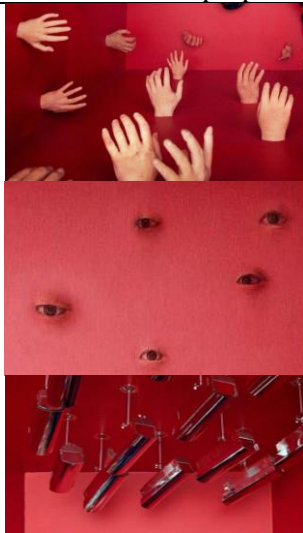
Gambar 11 . properti foto konsep Love Yourself: Answer versi S