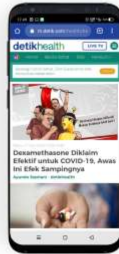
Gambar 13. Mockup media utama pada Detik.com.

Peletakan desain kampanye pada post Instagram dapat dilihat seperti gambar diatas, dengan desain sama persis seperti pada rancangan sebelumnya.