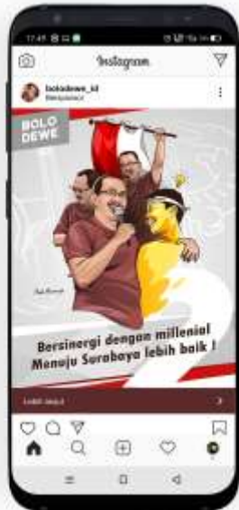
Gambar 12. Mockup media utama pada Post Instagram.

Penempatan desain pada media sosial ini sebagai pendukung akan media baliho yang ditampilkan di pinggir-pinggir jalan Kota Surabaya. Desain kampanye ini telah peneliti rancang supaya fleksibel yang penempatannya dapat pula pada Media –media sosial yang sedang digemari oleh millennial seperti: instagram, serta menggunakan media surat kabar online seperti: detik.com.