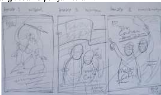
Gambar 2. Sketsa kasar 3 konsep desain baliho.

Penulis merancang sketsa untuk 3 konsep desain baliho caleg dengan menerapkan teknik layout, typografi, dan prinsip-prinsip desain lain yang sudah dipelajari selama ini.