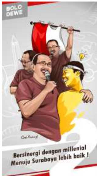
Gambar 4. Final desain untuk konsep Bersinergi dengan millennial

desain final berwarna untuk konsep Bersinergi dengan millennial.