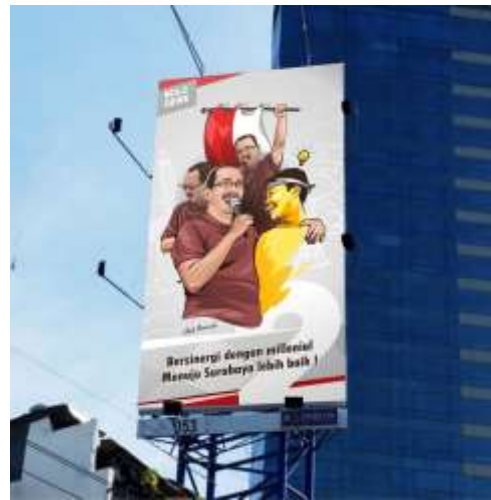
Gambar 11. Baliho Cak Ji di Jl. Arjuna.

Lalu berlanjut mengulas pada font untuk Penggunaan tagline merupakan kombinasi antara font script dengan san serif diatas, dengan begtuiu akan menghasilkan kesan muda, dinamis dan elegan. Dengan pemilihan warna sama seperti desain baliho sebelumnya dengan kesan yang sama pula.