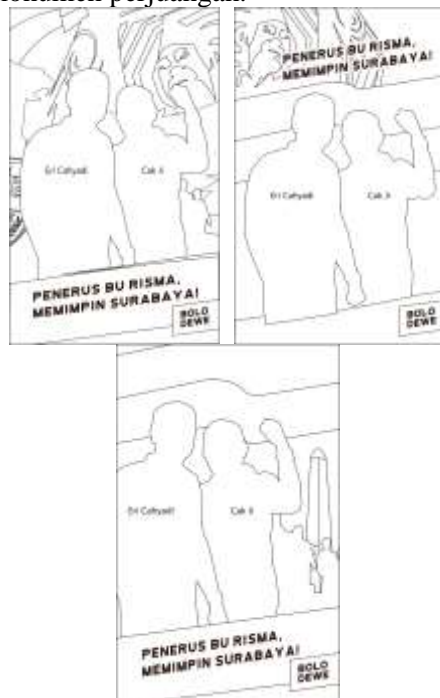
Gambar 6. Thumbnail untuk konsep pemimpin

Untuk thumbnail pertama disini peneliti menggambarkan Cak Ji dan Eri Cahyadi yang berpose berjajar dengan ekspresi percaya diri dan berpose seorang pemimpin yang dihiasi dengan background bung Tomo, bendera merah putih dan monumen perjuangan.