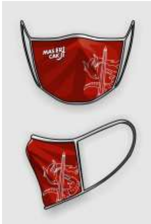
Gambar 14. Desain media masker.

Desain dirancang dengan menggunakan warna utama merah dengan aksent putih pada tali dan gambar. Visual yang ditampilkan ialah ikon kota Surabaya yaitu Sura dan Baya, serta tagline logo “Mas Eri, Cak Ji”.