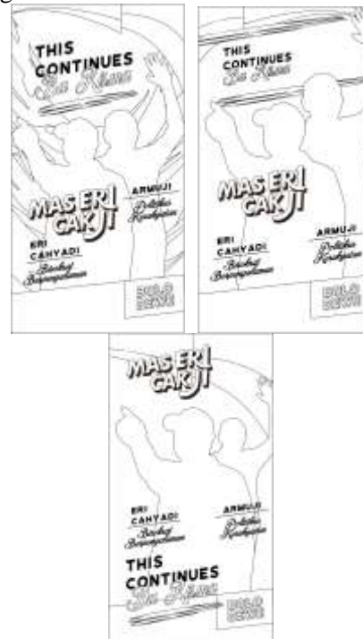
Gambar 9. Thumbnail konsep Penerus yang merakyat

Thumbnail pertama memperlihatkan dua sosok yang sedang berpose menyapa warga dengan background pendukung yang seolah menonjolkan dua sosok tersebut adalah tokoh berpengaruh.