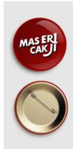
Gambar 16. Desain media Pin.

Pin digunakan sebagai media pendukung selanjutnya untuk sekadar bonus untuk penerima masker dan topi. Pin disini murni untuk alat pemasaran nama CakJi. Berikut Desainnya