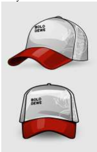
Gambar 15. Desain media Topi.

Topi menjadi media pendukung selanjutnya untuk mendukung pula media pendukung 1 dalam menghadapi new normal pandemi Covid-19 dengan melindungi diri menggunakan topi. Berikut desainnya: