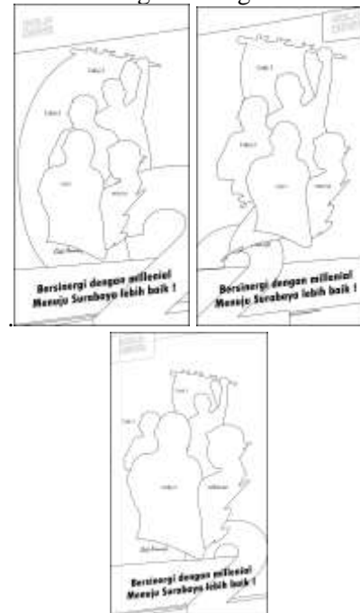
Gambar 3. Thumbnail untuk konsep Bersinergi dengan millennial

Disini penulis membuat 3 thumbnail hitam putih untuk setiap konsep karya, setelah itu akan dipilih dari 3 pilihan untuk dijadikan desain final yang berwarna. Thumbnail pertama menggunakan layout asmetris yang menunjukkan 4 objek terlihat mengalir mengikuti alur bendera.