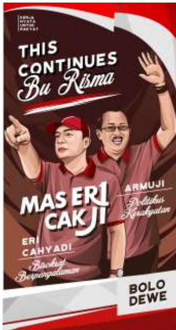
Gambar 10. Desain final untuk konsep Penerus yang merakyat.

Desain ketiga dengan konsep penerus yang merakyat, menampilkan calon walikota yang nampak berwibawa berpose menunjuk kedepan dengan makna berpikiran maju dalam memandang masa depan surabaya dan wakilnya yang tampak sedang ramah menyapa warga. Dengan background yang nampak mendukung citra point of interest dengan bentuk seperti angin yang berhembus menyimbolkan kepiawaian.