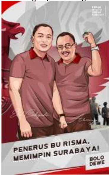
Gambar 7. Desain final untuk konsep kedua

Untuk thumbnail kedua di sini menggambarkan dua sosok pemimpin dengan background lebih simpel yang menggunakan layout simetris rata tengah untuk menimbulkan kesan ringkas. Thumbnail ketiga disini menggunakan layout asimetris dengan fokus ke objek di sebelah kiri yang dihiasi dengan background tugu pahlawan dan bendera besar. Terpilihlah thumbnail ke-1 sebagai sketsa untuk selanjutnya dijadikan desain final berwarna untuk konsep kedua dengan pertimbangan kompleksitas