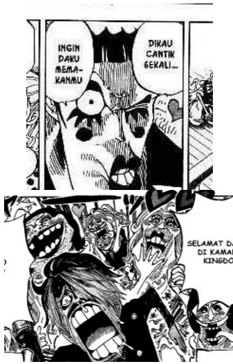
Gambar 9 Riasan Wajah Beberapa Karakter

Seperti yang terlihat pada gambar diatas riasan wajah di gunakan hampir oleh semua transgender dalam komik one piece, sementara perempuan dalam komik tersebut cenderung lebih berwajah natural tanpa riasan. Sepertinya Oda mencoba memberikan ciri khas tersendiri kepada para transgender dalam komik one piece. Hal ini digunakan agar dapat membedakan antara laki-laki dan transgender namun agar tidak menyerupai perempuan dalam komik One Piece transgender dalam komik tersebut cenderung memiliki riasan wajah yang menor.