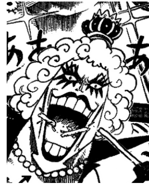
Gambar 10 Mahkota Ivankov