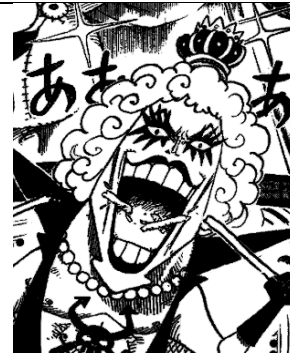
Gambar 8 Riasan Wajah Ivankov