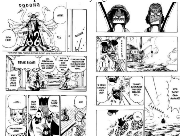
Gambar 13 Kemunculan Karakter Bon Clay

Clay, dia di perkenalkan sebagai musuh dari karakter utama dari serial komik One Piece pada awalnya, namun kemudian berubah menjadi sahabat yang setia kawan karna memang sejatinya dia merupakan karakter yang baik hati.