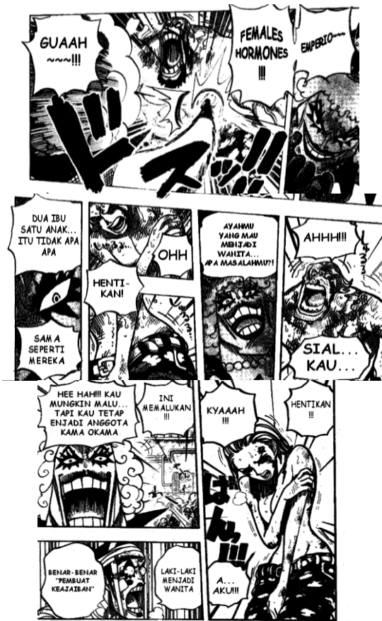
Gambar 11 Ivankov Merubah Bentuk Tubuh Seseorang