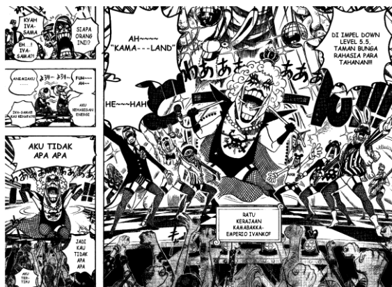
Gambar 4 Kemunculan Debut Karakter Ivankov (Sumber: Komik One Piece Chapter 537)