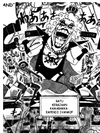
Gambar 6 Tampilan fisik Ivankov