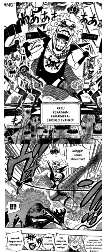
Gambar 5 Tampilan fisik Ivankov (Sumber: Komik One Piece Chapter 537 dan 543)