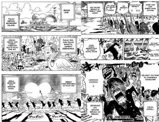
Gambar 12 Pulau Momoiro