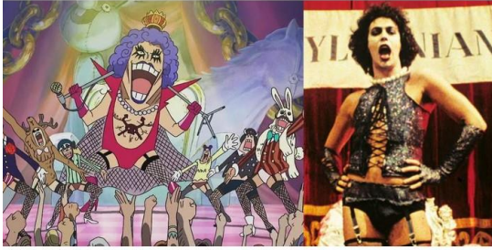
Gambar 7 Perbandingan Tampilan Ivankov Dan Tim Curry

Karakter Ivankov ini memiliki kemiripan dengan karakter film The Rocky Horror Picture Show yaitu Tim Curry dari segi berpenampilan. Ivankov memiliki penampilan yang nyentrik yang membuat semua orang selalu tertuju padanya. Lewat pakaian, dandanannya, dan tingkah lakunya, penampilan tubuh manusia bisa terlihat jelas. Melalui pakaian setiap periode, manusia dapat memberikan pernyataan yang sangat kuat tentang kelas, status, dan jenis kelamin yang berlaku pada masanya. Melalui pakaian, setiap orang seolah mengkomunikasikan identitas sosialnya (Misbahuddin and Sholihah 2018). Dalam hal ini memperlihatkan penyimpangan yang terjadi pada karakter Ivankov melalui cara berpakaianannya, karena barang seperti stocking kotak-kotak, high heels merupakan barang yang umumnya dipakai oleh para perempuan. Umumnya laki-laki memakai pakaian yang bersifat minimalis dan tidak terlalu mencolok.