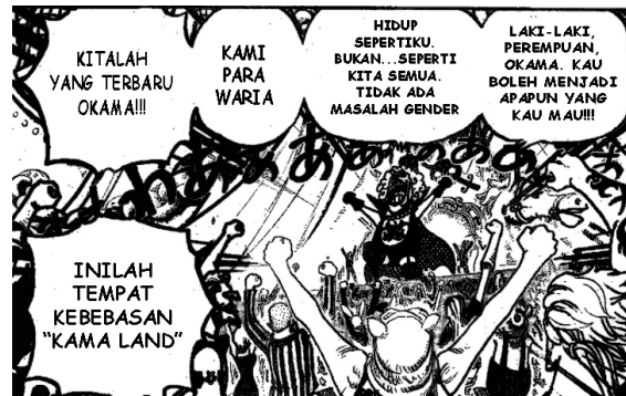
Gambar 14 Ivankov mengatakan dia adalah Transgender (Sumber: Komik One Piece Chapter 537)

Namun dengan kemunculan karakter Ivankov semakin mempertegas adanya penyimpangan perilaku transgender dalam komik One Piece, karena dijelaskan dalam buku Diagnosis Gangguan Jiwa, Rujukan Ringkasan PPDGJ-III dan DSM-5 seseorang transgender memiliki gambaran identitas seperti keinginan untuk merubah tubuh semirip mungkin dengan lawan jenisnya, mrnggenakan pakaian lawan jenis, hingga hasrat untuk mengubah jenis kelamin (Muslim, 2013). Ivankov juga dengan terang-terangan mengatakan “laki-laki, perempuan, waria. Kau boleh menjadi apapun yang kau mau! Tidak ada masalah gender. Kami para waria, inilah tempat kebebasan”. Dari kata-kata tersebut Ivankov dengan tegas mengatakan bahwa dirinya merupakan seorang transgender yang bisa kita ketahui bahwa transgender merupakan sebuah perilaku yang menyimpang dari norma-norma atau adat yang berlaku dalam kehidupan bersosial dan juga bermasyarakat yang telah kita pahami selama ini.