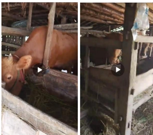
Gambar 1. Peternakan Sapi Madura Hasil Menabung Cak Agus

Gaya hidup sederhana terlihat dari Mbak Fila dan suaminya yang rela tinggal di kontrakan sempit seluas 6 meter persegi yang sekaligus berfungsi sebagai warung, tempat tidur, dapur, dan kamar mandi. Pengorbanan kenyamanan fisik ini dilakukan secara sadar demi menjaga stabilitas finansial dan pertumbuhan usaha. Selain itu, orientasi reinvestasi laba yang produktif juga dilakukan oleh Cak Agus untuk diinvestasikan ke toko bangunan dan bisnis sapi hingga ke luar pulau. Berdasarkan wawancara terakhir pada tanggal 11 Februari 2026, Cak Agus mengatakan bahwa hasil dari tabungannya yang diberikan ke bapaknya ialah delapan ekor sapi. Terakhir pulang kampung ke Madura, sapi milik bapaknya tersisa empat ekor, karena empat ekor yang lain sudah dikirim ke pelanggan.