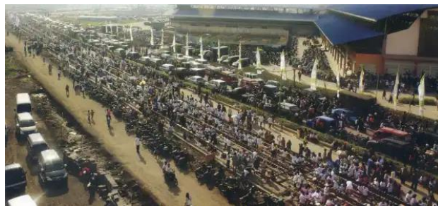
Gambar 1.4 Suasana Kegiatan Bakar Bandeng di Pasar Induk Puspa Agro

Bersamaan dengan momen peresmian Pasar Induk Puspa Agro, pihak pengelola juga menyelenggarakan festival pesta pembakaran ikan bandeng yang berhasil memecahkan dua rekor Museum Rekor Indonesia (MURI) sekaligus dalam satu perhelatan acara. 19 Rekor yang diraih meliputi kategori panggangan ikan terpanjang di Indonesia sepanjang 5,5 kilometer serta aktivitas pembakaran ikan bandeng secara massal dengan lintasan sejauh 5,2 kilometer yang melibatkan penggunaan 6,5 ton ikan bandeng, 6 ton arang, dan 2,5 ton minyak tanah. 20 Perhelatan berskala sangat besar ini berhasil mengkonsolidasi berbagai elemen masyarakat secara masif mulai dari kalangan pedagang, petani hingga masyarakat dari berbagai wilayah di Jawa Timur yang datang untuk mengikuti acara kegiatan tersebut.