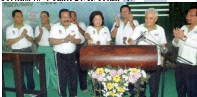
Gambar 1.2 Momen Peresmian Pasar Induk Puspa Agro

Pasar Induk Puspa Agro akhirnya diresmikan pada tanggal 17 Juli 2010 yang diselenggarakan dengan sangat meriah sebagai perayaan atas terwujudnya sebuah infrastruktur perdagangan agribisnis modern yang telah direncanakan selama bertahun-tahun. Acara peresmian dihadiri oleh para pejabat tinggi negara diantaranya, Hatta Rajasa selaku Menteri Koordinator Bidang Perekonomian sebagai pejabat yang meresmikan pasar induk ini secara resmi, disaksikan oleh Mari Elka Pangestu selaku Menteri Perdagangan, Suswono selaku Menteri Pertanian, dan Fadel Muhammad selaku Menteri Kelautan dan Perikanan serta Gubernur Jawa Timur Dr. H. Soekarwo. 18