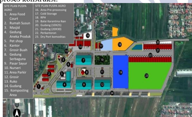
Gambar 1.1 Site plan Pasar Induk Puspa Agro

Pembangunan Pasar Induk Puspa Agro akhirnya dimulai pada bulan September 2008 sebagai titik awal dari fase konstruksi yang berlangsung selama kurang lebih dua tahun penuh. 10 Seluruh fasilitas utama pasar seperti gedung pusat, los perdagangan, area grosir dan sub-grosir, fasilitas cold storage , serta berbagai sarana penunjang lainnya dibangun secara bertahap sesuai dengan rencana induk yang telah disiapkan. Skala pembangunan yang sangat besar ini membutuhkan koordinasi yang sangat intensif antara PT Jatim Grha Utama sebagai pengelola proyek dengan berbagai pihak kontraktor dan instansi terkait yang dilibatkan dalam proses konstruksi.