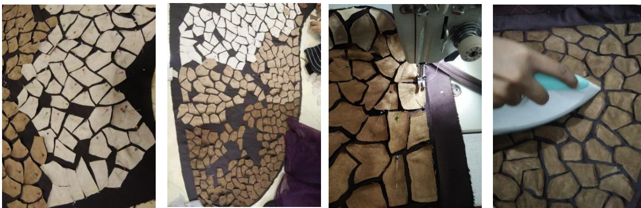
Gambar 4. Penerapan Teknik Aplikasi Motif Vertisol Pada Busana Pesta Malam

Adapun beberapa langkah dalam proses pembuatan teknik aplikasi seperti pada gambar 4, secara detail adalah sebagai berikut: mengukur pola rok kemudian dibagi menjadi 3 yaitu atas, bawah dan tengah untuk perbedaan warna teknik aplikasi. Membuat desain pada bagian buruk kain, mengawali dengan kain yang paling muda yaitu warna cream yang akan diletakkan pada bagian atas. Membuat desain sesuai dengan sumber ide yaitu berbentuk abstrak terdapat 4 atau 5 sisi karena bentuk rekahan tidak selalu bisa sama satu dengan lainnya. Jika desain di kain awal selesai kemudian lanjut di warna kedua yaitu coklat muda yang akan diletakkan pada bagian bawah kain cream . Kemudian membuat desain pada kain coklat tua yang akan diletakkan pada bagian bawah. Langkah selanjutnya menyolder kain sesuai desain yang sudah ada pada bagian buruk kain. Menyolder kain dengan cara rapat dengan bagian yang lain, agar mempermudah untuk menata motifnya nanti. Diawali dengan menyolder kain cream , coklat muda kemudian coklat tua. Merapikan kain yang telah disolder dengan cara menggunting kain yang terdapat bekas solder pada pinggiran kain agar rapi dan terpisah dengan bagian lainnya.