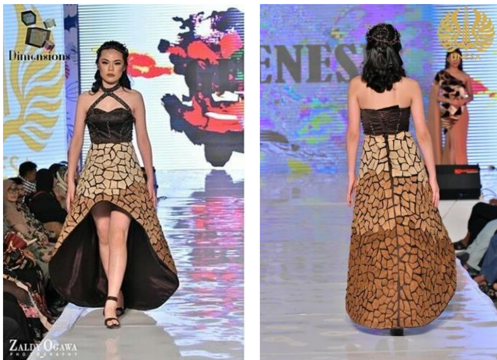
Gambar 5. Hasil Jadi Busana Pesta Malam

Hasil jadi busana dapat ditinjau dari beberapa aspek, menyesuaikan dengan ciri-ciri busana pesta malam. Apabila melihat dari pemilihan desain, busana pesta malam terinspirasi dari vertisol ini tergolong dalam kategori busana pesta malam gala karena jenis desain ini hanya digunakan untuk acara-acara khusus saja, karena busana ini unik, yaitu dengan adanya teknik aplikasi motif vertisol yang belum ada di busana pesta malam lainnya. Bahan yang digunakan dalam busana pesta ini memenuhi kriteria bahan untuk busana pesta. Pemilihan bahan utama untuk busana pesta malam ini adalah Kain satin duchesse . Duchesse Satin adalah satin yang memiliki tingkat kilau tinggi, memiliki tekstur agak tebal, ditenun menggunakan tenunan satin. (Rohmah yang dikutip Jerde,2015:2).