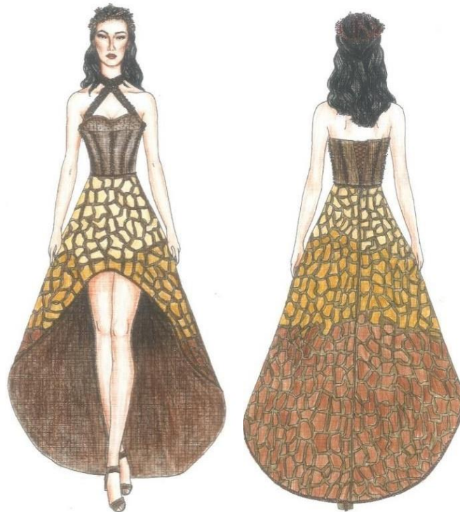
Gambar 3. Desain Busana Pesta Malam

jepang pada bagian rok dan pada bagian bustier menggunakan lapisan sengkeli. Penerapan teknik aplikasi kain pada busana pesta malam ini menggunakan kain suede dengan 3 macam warna yang sesuai dengan sumber ide. Teknik aplikasi kain ini menggunakan mesin jahit dengan menempelkan satu per satu potongan kain sesuai desain yang diinginkan dan diberi jarak disetiap potongan kainnya.