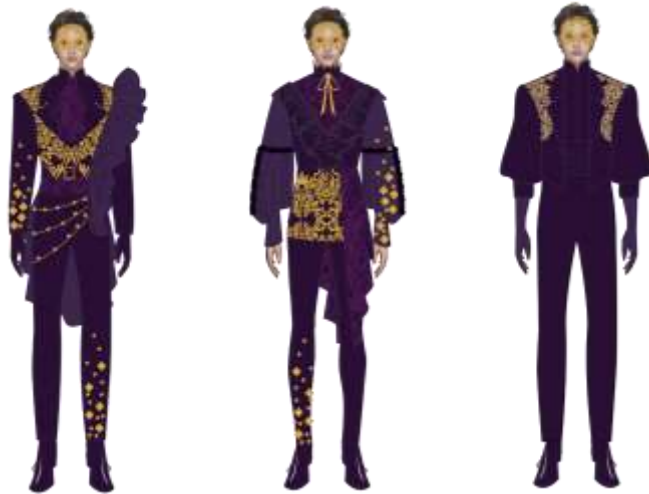
Gambar 6. Pengembangan Desain Busana Pesta Malam Pria

Gambar 6 menampilkan tiga pengembangan desain busana pria yang akan dipilih satu untuk diwujudkan. Busana pesta malam pria terdiri dari kemeja, waistcoat , obi dan pantalon. Teknik bordir dan draping diaplikasikan secara beragam guna menampilkan sisi maskulin namun unik. Penggunaan topeng aplikasi payet juga dihadirkan menciptakan keserasian dengan busana wanita yang menjadi gambaran dalam pesta malam topeng. Bahan utama yang digunakan yaitu kain semi wol ( donoratico ) yang tidak mengkilap untuk menciptakan kesan maskulin dan elegan serta menjaga harmonisasi dengan busana wanita. Bahan pelengkap berupa kain satin yang digunakan untuk menciptakan variasi dalam bahan.