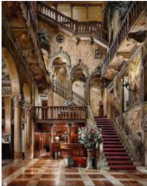
Gambar 2. Atrium Palazzo Dandolo

penerangan alami dari matahari, sedangkan saat malam hari suasana lembut berganti menjadi glamor misterius yang kental. Suasana inilah yang menjadi ciri khas dari istana Palazzo Dandolo .