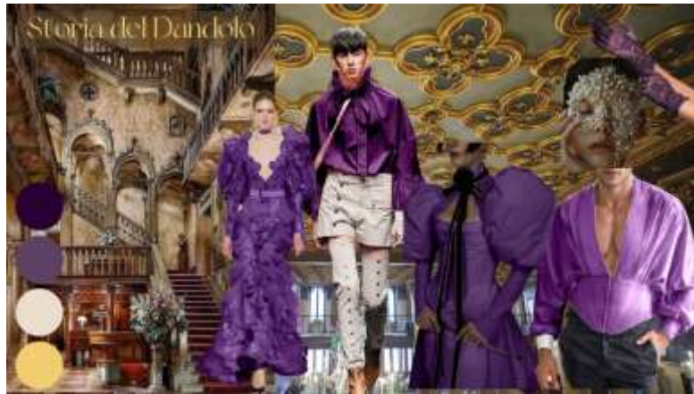
Gambar 4. Moodboard