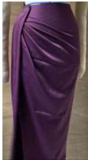
Gambar 10. Prototype Busana Wanita

Deliver merupakan tahap akhir dalam metode Double Diamond Model . Tahap ini berfokus pada penerapan solusi yang telah dikembangkan. Pada proses ini prototype dibuat dan diuji, lalu dilanjut penyempurnaan hingga finishing menjadi produk yang siap untuk digunakan. Desain yang sudah terpilih dibuat prototype lalu diuji kelayakannya. Hasil jadi prototype mempengaruhi pola yang ditentukan, jatuhnya kain, kebutuhan kain yang digunakan, kesesuaian dengan desain, teknik menjahit, serta tampilan keseluruhan busana yang layak digunakan dan dipasarkan. Selain itu keberhasilan pembuatan manipulating fabric juga bergantung pada hasil uji coba. Tahap deliver , merupakan kunci menciptakan busana yang berkualitas dan bermutu.