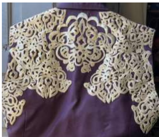
Gambar 13. Bordir pada Waistcoat

Busana pesta pria terdiri dari kemeja, waistcoat , obi dan pantalon. Kemeja memiliki lengan pof pada bagian bawah serta tambahan payet berwarna emas champagne untuk menggambarkan ciri khas busana pria pada abad ke-18 di Venesia. waistcoat dihiasi dengan bordir yang terinspirasi dari motif ukiran gotik Venesia. Bordir diaplikasikan pada area depan dan belakang waistcoat dengan menggunakan benang warna emas champagne untuk menambah efek kilau namun tetap maskulin. Sedangkan obi dibuat dengan menerapkan manipulating fabric draped pleats agar serasi dengan busana wanita yang menerapkan manipulating fabric serupa.