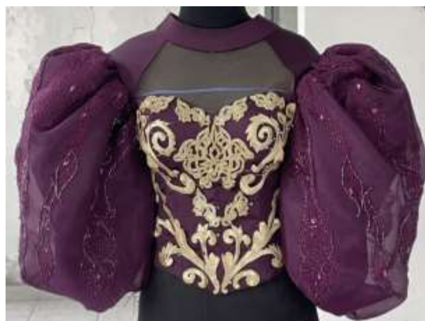
Gambar 12. Bordir pada Bustier

Ukiran gotik Venesia menjadi inspirasi manipulating fabric bordir. Bordir dibuat dengan mesin manual untuk menampilkan efek 3 dimensi pada motif yang diaplikasikan pada bustier. Sebelum motif dibordir, pertama dilakukan pembuatan desain bordir pada kertas transparan, lalu disesuaikan pada bentuk bustier sehingga ukuran motif sesuai dengan ukuran dan bidang bustier. Bordir dibuat menggunakan benang metalik berwarna emas champagne dengan aplikasi payet warna serupa pada pinggiran bordir agar menciptakan efek kilau yang menyerupai ukiran pada interior Palazzo Dandolo . Warna emas champagne yang disatukan dengan dark purple menciptakan tekstur mewah dan menawan.