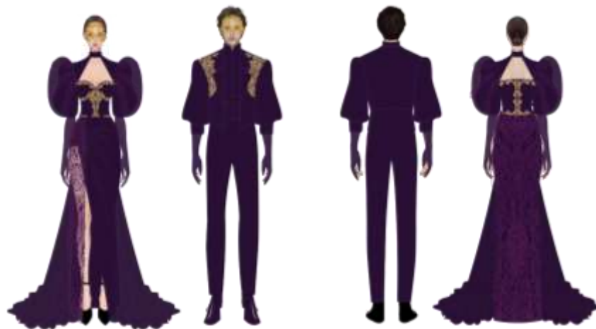
Gambar 7. Desain Terpilih

Gambar 6 menampilkan tiga pengembangan desain busana pria yang akan dipilih satu untuk diwujudkan. Busana pesta malam pria terdiri dari kemeja, waistcoat , obi dan pantalon. Teknik bordir dan draping diaplikasikan secara beragam guna menampilkan sisi maskulin namun unik. Penggunaan topeng aplikasi payet juga dihadirkan menciptakan keserasian dengan busana wanita yang menjadi gambaran dalam pesta malam topeng. Bahan utama yang digunakan yaitu kain semi wol ( donoratico ) yang tidak mengkilap untuk menciptakan kesan maskulin dan elegan serta menjaga harmonisasi dengan busana wanita. Bahan pelengkap berupa kain satin yang digunakan untuk menciptakan variasi dalam bahan.