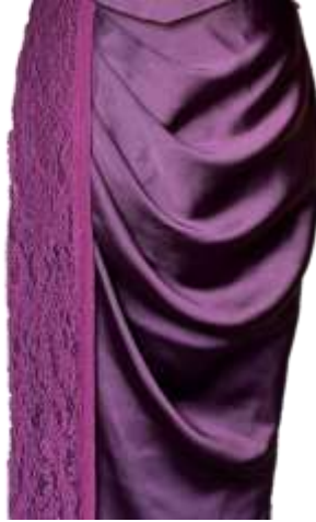
Gambar 11. Draped Pleates pada Rok

diwujudkan dengan manipulating fabric draping . Jenis draping yang dibuat adalah draped pleats . Cara membuatnya dengan menyiapkan selembar kain berukuran 4 meter kemudian dilekatkan pada manekin sesuai titik tengah dan garis pinggang, berikutnya dibentuk draped pleats dengan memperhatikan arah jatuh lipit dari garis pinggang hingga batas yang telah ditentukan. Rok draping dikombinasikan dengan kain chantilly lace untuk memberikan kesan kilau dengan tekstur seperti pada tangga atrium Palazzo Dandolo .