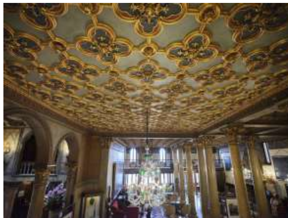
Gambar 3. Ukiran Motif Gotik Venesia