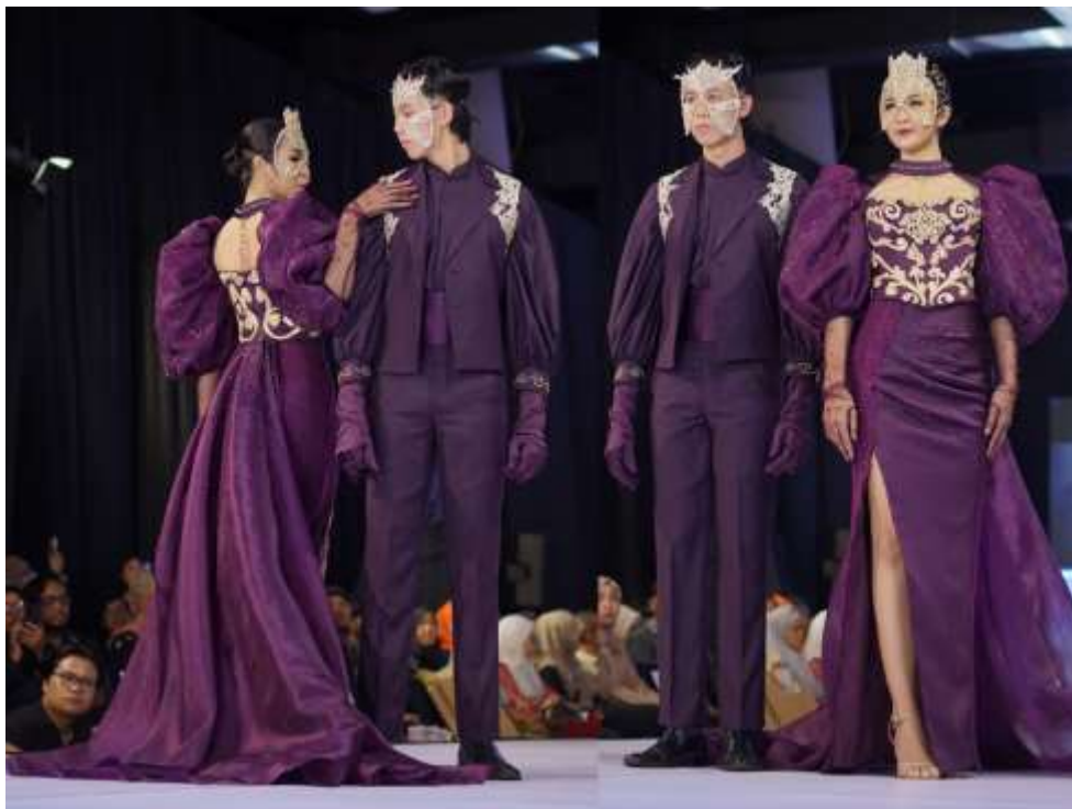
Gambar 14. Hasil Jadi Busana Pesta

Produk akhir dari proses perancangan busana pesta malam ini berupa sepasang busana pesta yang dilengkapi dengan ornamen dan aksesoris pelengkap. Kedua busana tersebut didesain sebagai satu kesatuan yang serasi sesuai dengan gambaran pasangan aristokrat yang hadir dalam pesta malam di Palazzo Dandolo . Karya busana ini telah ditampilkan dalam acara 3rd Annual Fashion Show Vocational Fashion Design UNESA 2025 yang bertajuk Aristovance . Penampilan busana yang elegan dan misterius dimana identitas disembunyikan di balik topeng namun sarat akan lambang kemewahan khas bangsawan.