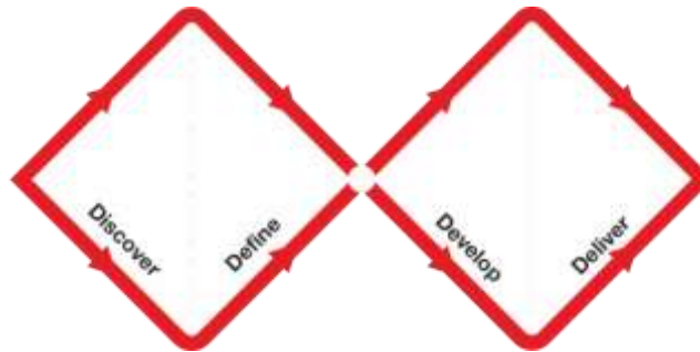
Gambar 1. Double Diamond Model

Metode yang digunakan dalam penelitian ini adalah metode Double Diamond Model . Merupakan kerangka kerja desain yang digunakan untuk menghasilkan solusi inovatif terhadap permasalahan melalui proses yang terstruktur dalam empat tahap utama: Discover , Define , Develop , dan Deliver (Jifti & Jifti, 2022). Ciri khas metode Double Diamond Model adalah penggunaan pola divergen (membuka kemungkinan seluas-luasnya) dan konvergen (mempersempit pada solusi terbaik) pada setiap fase utamanya ( The Double Diamond - Design Council, 2023 ). Metode ini efektif dalam mengatasi tantangan desain dan inovasi, serta memprioritaskan kebutuhan manusia.