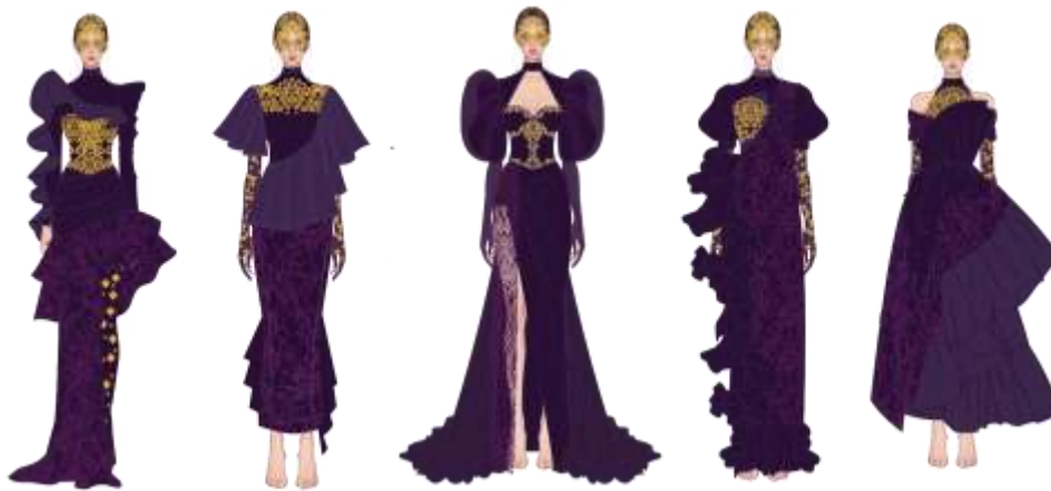
Gambar 5. Pengembangan Desain Busana Pesta Malam Wanita

Pada tahap develop atau pengembangan, berbagai solusi potensial dikembangkan dan diuji melalui proses ideasi, prototyping dan iterasi (Ramadhan, 2024). Pada tahap ini acuan desain yang telah ditentukan dikembangkan melalui beberapa tahapan yaitu penguatan konsep, penyelarasan bentuk, penyesuaian manipulating fabric dan ornamen busana. Sumber ide dan inspirasi visual yang dikumpulkan dalam moodboard dianalisis dan dikembangkan untuk menghasilkan desain busana pesta yang memiliki nilai estetika, kesesuaian tema dan keunikan. Temuan dari hasil analisis tersebut kemudian dituangkan ke dalam ilustrasi desain, yang selanjutnya digunakan sebagai acuan dalam proses pembuatan prototype pada tahap berikutnya.