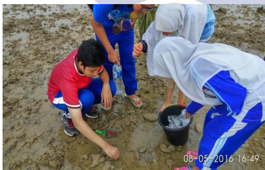
Gambar 1. Aktivitas Siswa Saat Kegiatan Field Trip Jelajah Pantai di Pantai Jumiang, Pamekasan

Berdasarkan hasil belajar pada ranah sikap siswa yang diperoleh dari lembar penilaian diri, nilai rata-rata siswa yang diperoleh termasuk dalam kriteria “Sangat Baik” (Tabel 3). Sikap yang dilatihkan pada siswa sesuai dengan indikator, yaitu kerjasama, disiplin, tanggung jawab, dan teliti. Kegiatan field trip jelajah pantai dapat melatih kerjasama melalui penempatan siswa secara berkelompok, disiplin melalui kegiatan pengamatan dan eksplorasi di pantai, tanggung jawab melalui tugas-tugas yang diberikan kepada siswa, dan teliti melalui kegiatan klasifikasi hewan invertebrata hasil temuan siswa.