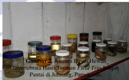
Gambar 2. Awetan Basah Hewan Invertebrata Hasil Temuan Field Trip Jelajah Pantai di Jumiang, Pamekasan.

Adanya peningkatan hasil belajar siswa dipengaruhi oleh pengalaman belajar siswa setelah pembelajaran dengan mengintegrasikan metode field trip jelajah pantai. Pengalaman yang diperoleh siswa diantaranya, yaitu siswa mengamati secara langsung hewan invertebrata yang dipelajari, siswa melakukan eksplorasi hewan invertebrata di daerah pantai, siswa bekerjasama dalam membuat awetan hewan invertebrata hasil temuannya di pantai, siswa melakukan klasifikasi hewan invertebrata hasil temuan field trip jelajah pantai. Hal tersebut sesuai dengan pendapat Suyono dan Harianto (2014) yakni hasil belajar dipengaruhi oleh pengalaman belajar sebagai hasil interaksi pelajar dengan lingkungan.