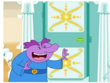
Gambar 2. Video Penunjang Materi

baik. Selain itu, Prezi memiliki berbagai desain unik dan banyak icon yang berhubungan erat dengan kehidupan sehari-hari yang dimanfaatkan peneliti untuk mendukung materi.