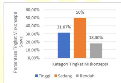
Gambar 2. Kategori tingkat miskonsepsi.

Miskonsepsi ialah suatu pemahaman atau pengetahuan yang diyakini seseorang yang tidak sama dengan konsep yang diyakini para ahli. Berdasarkan persentasenya, miskonsepsi dapat dibagi menjadi tiga tingkat yakni miskonsepsi tinggi, sedang dan rendah seperti pada Tabel 2 . Berdasarkan hasil penelitian, didapatkan bahwa sebesar 31,67% siswa termasuk dalam miskonsepsi tinggi, 50% siswa termasuk dalam miskonsepsi sedang, dan 18,3% siswa termasuk dalam miskonsepsi rendah. Kategori tingkat miskonsepsi ini dapat dilihat atau diperjelas pada Gambar 2 . sebagai berikut.