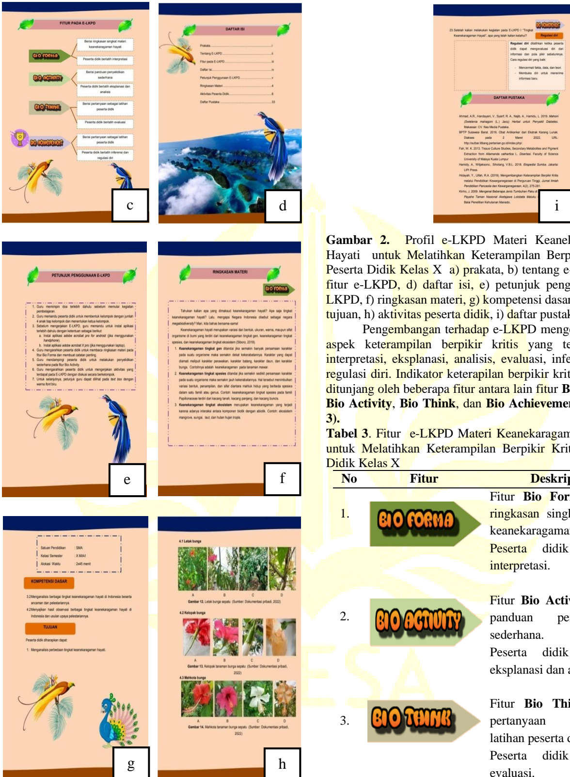
Gambar 2. Profil e-LKPD Materi Keanekaragaman Hayati untuk Melatihkan Keterampilan Berpikir Kritis Peserta Didik Kelas X a) prakata, b) tentang e-LKPD, c) fitur e-LKPD, d) daftar isi, e) petunjuk penggunaan e-LKPD, f) ringkasan materi, g) kompetensi dasar (KD) dan tujuan, h) aktivitas peserta didik, i) daftar pustaka

Pengembangan terhadap e-LKPD mengedepankan aspek keterampilan berpikir kritis yang terdiri atas interpretasi, eksplanasi, analisis, evaluasi, inferensi, dan regulasi diri. Indikator keterampilan berpikir kritis tersebut ditunjang oleh beberapa fitur antara lain fitur Bio Forma , Bio Activity , Bio Think , dan Bio Achievement (Tabel 3).