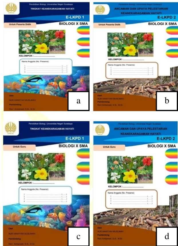
Gambar 1. Materi Keanekaragaman Hayati untuk Melatihkan Keterampilan Berpikir Kritis Peserta Didik Kelas X a) e-LKPD 1 peserta didik, b) e-LKPD peserta didik, c) e-LKPD 1 guru, d) e-LKPD 2 guru

“Ancaman dan Upaya Pelestarian Keanekaragaman Hayati” (Gambar 2).