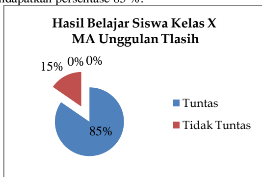
Gambar 1. Diagram hasil belajar siswa kelas X MA Unggulan Tlasih

Berdasarkan hasil analisis data menunjukkan bahwa sebagai besar siswa sudah bisa menguasai konsep yang telah diajarkan dengan menggunakan LKS kecakapan hidup. Secara klasikal ketuntasan belajar kelas mendapatkan persentase 85 %.