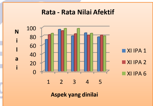
Gambar 1 : grafik rata-rata nilai afektif

Analisis hasil penilaian aktivitas siswa terbagi menjadi dua, yaitu penilaian afektif dan penilaian psikomotor. Penilaian afektif siswa dilakukan untuk mengetahui sejauh mana siswa mampu menunjukkan sifat berkarakter dalam pembelajaran. Penilaian afektif siswa terdiri dari lima aspek, yaitu partisipasi siswa, perhatian siswa ketika guru menjelaskan, kedisiplinan siswa, ketepatan waktu dalam menyelesaikan percobaan dan kemampuan memperoleh data. Nilai rata-rata afektif secara klasikal untuk kelas XI IPA1 adalah 82, untuk kelas XI IPA 2 adalah 85 dan nilai rata-rata klasikal tertinggi dicapai oleh kelas XI IPA 6 yaitu sebesar 89. Hal ini dikarenakan suasana pembelajaran di kelas XI IPA 6 cukup kondusif dan terkendali dengan minat belajar siswa yang tinggi sehingga sebagian besar siswa aktif dalam kegiatan pembelajaran. Selain itu, jadwal pembelajaran fisika untuk kelas XI IPA 6 berada pada jam pertama sehingga kondisi fisik maupun pikiran siswa sangat mendukung dalam proses pembelajaran. Berdasarkan data nilai afektif rata-rata maka didapatkan grafik diagram batang sebagai berikut :