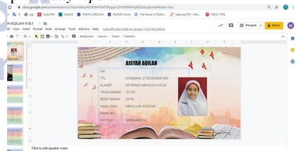
Gambar 2. Tampilan Daily Report

Daily report merupakan bentuk implementasi google suite for education di SD Al-Khairiyah 1 Surabaya yang ditujukan untuk stakeholder eksternal sekolah yakni wali murid siswa. Sejalan dengan pendapat Heryati (Farhana, 2018:13) yang mengemukakan tujuan implementasi SIM pendidikan adalah untuk memudahkan sekolah dalam menyajikan informasi secara lengkap kepada stakeholder, daily report yang dibuat google slide dari fitur google suite for education ini didesain menarik yang berisikan informasi dan data mengenai aktivitas siswa disekolah secara terstruktur. Berikut ini tampilan daily report :