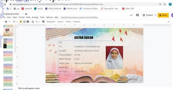
Gambar 2. Tampilan Daily Report

Daily report merupakan bentuk implementasi google suite for education di SD Al-Khairiyah 1 Surabaya yang ditujukan untuk stakeholder eksternal sekolah yakni wali murid siswa. Sejalan dengan pendapat Heryati (Farhana, 2018:13) yang mengemukakan tujuan implementasi SIM pendidikan adalah untuk memudahkan sekolah dalam menyajikan informasi secara lengkap kepada stakeholder, daily report yang dibuat google slide dari fitur google suite for education ini didesain menarik yang berisikan informasi dan data mengenai aktivitas siswa disekolah secara terstruktur. Berikut ini tampilan daily report :