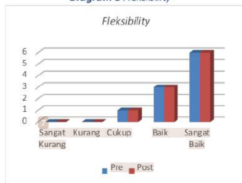
Diagram 1 Fleksibility

Berdasarkan hasil tersebut, maka dapat dikatakan bahwa fleksibility para atlet tarung derajat Kabupaten Kediri rata-rata dalam kategori baik. Artinya program latihan untuk fleksibility sudah sesuai dengan yang diharapkan.