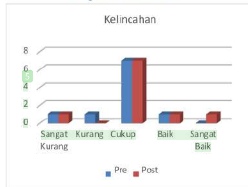
Diagram 5 Kelincuhan

Dari hasil tersebut menandakan bahwa kelincuhan para atlet tarung derajat Kabupaten Kediri rata-rata memiliki kategori cukup. Artinya latihan pada bagian kelincuhan sudah diterapkan dengan baik, namun harus ditingkatkan lagi menuju kategori baik ataupun sangat baik. Kelincuhan pada tarung derajat digunakan untuk menghindari serangan dari lawan dengan cepat.