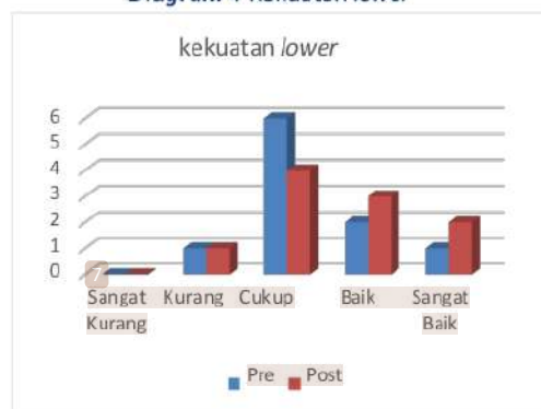
Diagram 4 Kekuatan lower

Dari hasil tersebut menandakan bahwa kekuatan lower body para atlet tarung derajat Kabupaten Kediri rata-rata memiliki kategori cukup. Artinya latihan pada bagian kekuatan lower body sudah diterapkan dengan baik, namun harus ditingkatkan menuju kategori baik maupun sangat baik agar saat pertandingan siap secara fisik. Berdasarkan hasil tes pada komponen otot kaki, dapat dilihat bahwa para atlet tarung derajat cenderung cukup baik. Akan tetapi harus ditingkatkan lagi karena batas pertandingan sewajarnya berkategori baik atau sangat baik. Hal ini memang diperuntukan agar dalam melakukan tendangan atlet akan lebih maksimal.