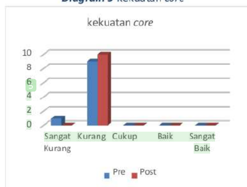
Diagram 3 Kekuatan core

Dari hasil tersebut menandakan bahwa kekuatan core body para atlet tarung derajat Kabupaten Kediri rata-rata memiliki kategori kurang. Artinya latihan pada bagian kekuatan core body sudah diterapkan dengan baik, namun harus ditingkatkan lagi menuju kategori baik ataupun sangat baik. Kekuatan ini digunakan untuk menjaga keseimbangan saat atlet memukul dan menendang, selain itu digunakan bagian ini digunakan sebagai sasaran serangan lawan maka harus kuat.