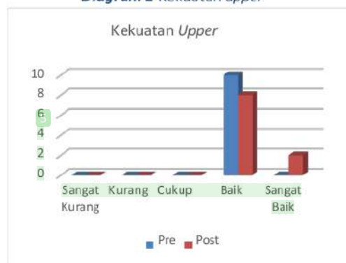
Diagram 2 Kekuatan upper

Dampak program latihan fisik terhadap biomotor kekuatan upper