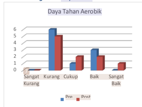
Diagram 7 Daya tahan aerobik

Dari hasil tersebut menandakan bahwa daya tahan para atlet tarung derajat Kabupaten Kediri rata-rata memiliki kategori cukup. Artinya latihan pada bagian kelincahan sudah diterapkan dengan baik, namun harus ditingkatkan lagi menuju kategori baik ataupun sangat baik. Daya tahan pada tarung derajat digunakan untuk tenaga untuk melakukan aktivitas yang. Karena dalam pertandingan tarung derajat dibutuhkan waktu yang lama maka daya tahan ini harus baik untuk atlet agar tidak mengalami mudah kelelahan. Menurut (Ihsan et al., 2018) Daya tahan aerobik merupakan faktor penunjang keberhasilan tendangan, karena teknik tendangan atlet tidak saja perlu kekuatan otot akan tetapi juga daya tahan aerobik, jika diimbangi maka tendangan depan pun tidak bisa maksimal dan tidak bisa mendapatkan point saat pertandingan.