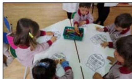
Gambar 6. Siswa TK mengenal Bee Bot