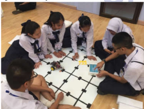
Gambar 5. Siswa SMA Thailand dan Jepang mencoba Arduducation Bot