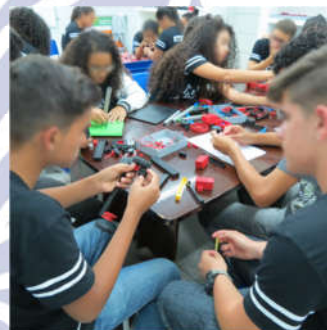
Gambar 8. Siswa SMP Brazil membuat robot