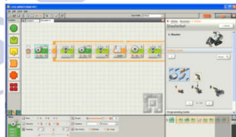
Gambar 3. Pemrograman blok LEGO Mindstroms