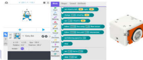
Gambar 1. Robot Entry and the Hamster