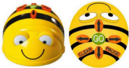
Gambar 4. Robot Bee Bot

11. Pada jurnal 11 : menggunakan robot “The Lego Mindstorms NXT 2.0 educational robotic kit” dikendalikan juga dengan pemrograman berbasis blok. Dari kesebelas jurnal semua penelitian menggunakan educational robotics dengan menggunakan pemrograman berbasis blok dalam penggunaannya. Dengan menggunakan pemrograman visual blok dapat menghindari kesalahan kompilasi yang biasanya muncul akibat kesalahan pengkodean pada pemrograman dengan bahasa tradisional. Kemudian siswa semakin tertarik dengan visual pemrograman blok yang lebih mudah daripada pemrograman tradisional biasa. Berpikir komputasi dapat di stimulus dengan menyelesaikan suatu masalah yang harus diselesaikan dengan media robot. Media robotik efektif digunakan didalam pengajaran karena dapat langsung menerapkan pembelajaran atau biasa disebut learning by doing . Media robotik juga mendukung pembelajaran karena dapat mendorong motivasi, kesan yang baik, sikap positif dan meningkatkan kinerja siswa (Kanda dkk, 2004).