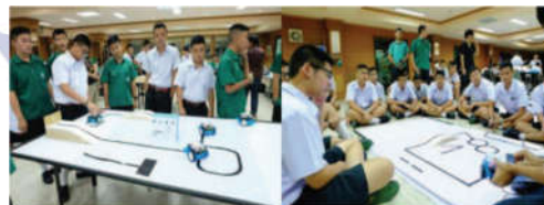
Gambar 7. Siswa SMA Thailand menggunakan mBot