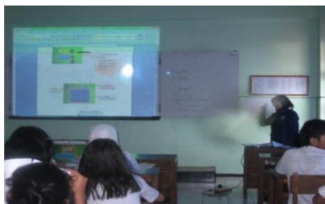
Gambar 2 Pembelajaran menggunakan video

Berdasarkan tabel hasil validasi dari dosen dan guru kimia di dapatkan Presentase kelayakan untuk kesesuaian format media sebesar 80,30% sedangkan untuk presentase kualitas media sebesar 81,25%.