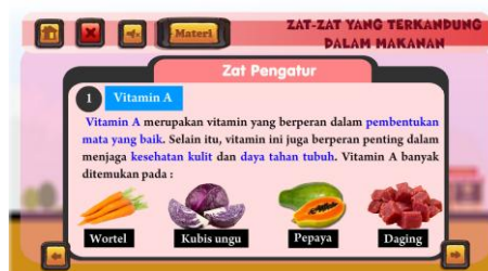
Gambar 2 Tampilan Materi Sesudah perbaikan

validasi. Gambar 2 adalah contoh dari hasil perbaikan multimedia interaktif.