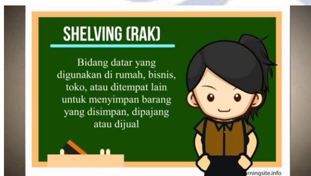
Gambar 1. Contoh Penyesuaian Karakter

Berdasar telaah diatas akan dilakukan perbaikan sesuai arahan para ahli. Berikut adalah contoh revisi yang dilakukan oleh peneliti :