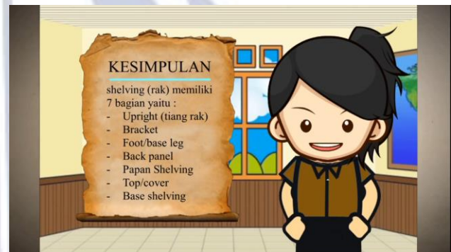
Gambar 3. Contoh Kesmpulan Materi

Setelah dilakukan revisi, maka media diserahkan kembali kepada validator untuk dilakukan penilaian ulang. Validasi dilakukan dengan menggunakan angket tertutup serta mendapatkan beberapa masukan dan saran untuk memperbaiki materi maupun media, sehingga dapat dinyatakan layak sebagai media pembelajaran audio visual. Pada tahap implementation media akan di uji cobakan kelas XI BDP 1 SMK Negeri 2 Kediri yang berjumlah 35 siswa.