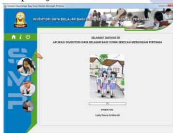
Gambar 4.1 Halaman Awal Software Inventori Gaya Belajar