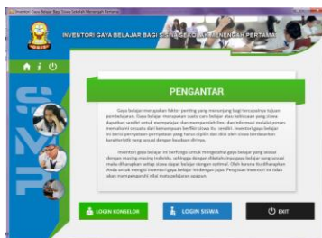
Gambar 4.2 Halaman Kedua Software Inventori Gaya Belajar