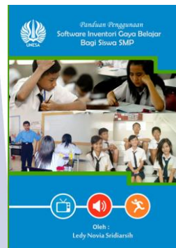
Gambar 4.4 Buku Panduan Penggunaan Software Inventori Gaya Belajar