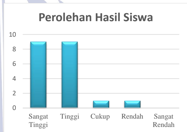
Grafik 2. Perolehan Hasil Siswa

Berdasarkan hasil perolehan diatas terlihat motivasi siswa dapat dikatakan sangat tinggi dengan ditarik hasil rata-rata maka sangat tingginya motivasi siswa terhadap modifikasi permainan tonnis dalam pembelajaran PJOK. Dengan metode permainan tonnis yakni permainan yang mudah untuk dilakukan, dengan harga alat yang cukup murah (Purnomo, 2014). Tingginya faktor perhatian terhadap olahraga tonnis, dikarenakan perhatian siswa yang tinggi untuk mengikuti perkembangan tonnis, menonton pertandingan tonnis, dan tingginya faktor perhatian terhadap guru dikarenakan perhatian siswa yang tinggi saat guru sedang memberikan dan menjelaskan materi olahraga tonnis. Hal ini terlihat ketika pembelajaran olahraga tonnis banyak siswa yang memperhatikan. Tingginya faktor perasaan siswa terhadap olahraga tonnis dikarenakan siswa yang merasa senang pada waktu mengikuti pembelajaran tonnis bukan hanya keterpaksaan dalam mengikuti kegiatan pembelajaran olahraga. Sedangkan tingginya faktor perasaan siswa terhadap pelatih atau guru dikarenakan guru mengajarkan tonnis dengan metode yang menyenangkan. sehingga siswa memperhatikan dan juga mengikuti perintah, petunjuk serta intruksi dari guru. Perhatian adalah pemusatan energi