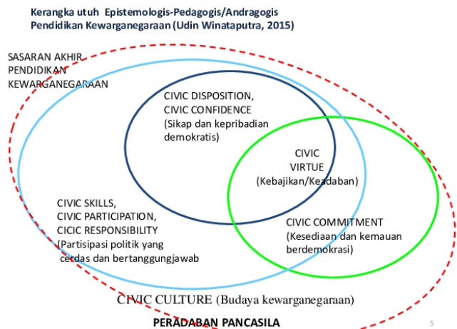
Gambar 1 Kerangka Epistemologi-Pedagogi PPKn (Winataputra, 2015)

Berkenaan dengan pemisahan karakter di atas, terdapat skema yang familiar untuk menjelaskan secara defintif terkait karakter kewarganegaraan ( civic disposition ) jika dibandingkan dengan kebajikan kewarganegaraan ( civic virtue ). Perbedaan utamanya adalah civic disposition lebih mengacu pada watak atau karakter seorang warga negara (termasuk pengetahuan dan keterampilan), sedangkan civic virtue adalah kebajikan atau nilai-nilai yang lebih spesifik yang mencakup kesediaan untuk mendahulukan kepentingan umum di atas kepentingan pribadi. Civic virtue adalah salah satu aspek dari civic disposition , yaitu sebuah watak yang mengutamakan kebajikan kewarganegaraan. Lebih spesifik civic virtue berfokus pada nilai-nilai seperti kesediaan untuk mendahulukan kepentingan publik di atas kepentingan pribadi, sebagaimana skema berikut.