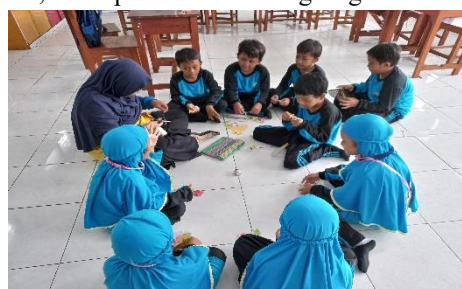
Gambar 1. Kerja sama dalam pembelajaran

Selain itu, dalam beberapa kesempatan terlihat bahwa peserta didik autis mulai menunjukkan inisiatif terbatas seperti menyerahkan alat tulis kepada teman atau mengikuti arahan anggota kelompok lain, meskipun masih dalam intensitas yang rendah. Aktivitas ini menunjukkan adanya keterlibatan dalam interaksi sosial yang bersifat kooperatif, meskipun belum berlangsung secara mandiri.