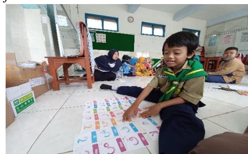
Gambar 4. Interaksi sosial terbatas

Selain itu, respon terhadap ajakan bermain atau komunikasi dari teman juga cenderung rendah. Peserta didik autis dalam kategori ini sering kali tidak memberikan respon atau hanya memberikan respon singkat tanpa melanjutkan interaksi.