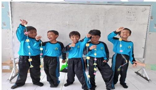
Gambar 2. Bermain bersama teman sebaya

Selain itu, dalam beberapa kasus ditemukan bahwa peserta didik autis mampu bertahan dalam aktivitas bermain selama periode waktu tertentu sebelum akhirnya kembali pada aktivitas individu. Hal ini menunjukkan adanya kemampuan adaptasi sosial meskipun masih terbatas pada durasi dan jenis aktivitas tertentu.