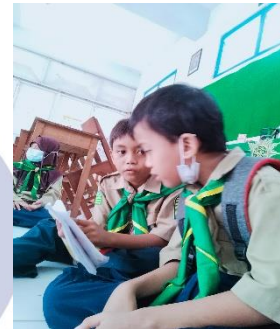
Gambar 3. Komunikasi sosial

Selain itu, variasi kemampuan komunikasi juga terlihat antarindividu. Beberapa peserta didik autis mampu menggunakan kalimat sederhana untuk berkomunikasi, sementara yang lain masih terbatas pada penggunaan kata-kata tunggal atau gestur nonverbal.