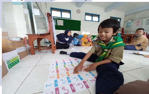
Gambar .4 interaksi sosial terbatas

Selain itu, respon terhadap ajakan bermain atau komunikasi dari teman juga cenderung rendah. Peserta didik autis dalam kategori ini sering kali tidak memberikan respon atau hanya memberikan respon singkat tanpa melanjutkan interaksi.