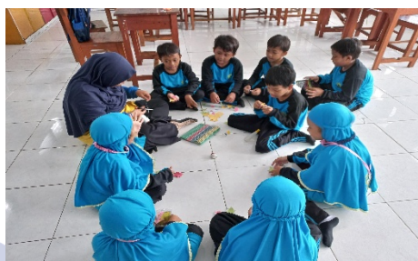
Gambar 1. Kerja sama dalam pembelajaran

inisiatif terbatas seperti menyerahkan alat tulis kepada teman atau mengikuti arahan anggota kelompok lain, meskipun masih dalam intensitas yang rendah. Aktivitas ini menunjukkan adanya keterlibatan dalam interaksi sosial yang bersifat kooperatif, meskipun belum berlangsung secara mandiri.