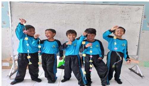
Gambar 2. Bermain bersama teman sebaya