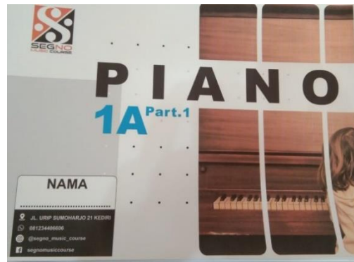
Gambar 1. Buku Piano 1A Segno Music Course

Pembuatan buku ini sendiri tidak lepas dari inovasi yang dilakukan oleh Owner Segno Music Course Ibu Esther Vivianti. Beliau menginginkan peserta didiknya memiliki wawasan yang luas terhadap musik sehingga membuat buku sebagai salah satu sumber belajar. Buku ini juga memiliki part-part sesuai dengan kelas masing-masing. Dalam buku ini ditulis secara sederhana supaya mempermudah peserta didik dalam mempelajari basic-basic dalam memainkan alat musik yang dipelajari.