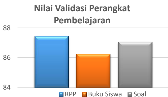
Gambar 2. Hasil Validasi Perangkat Pembelajaran

Untuk lebih memperjelas hasil validasi ketiga instrumen tersebut, histogram akan ditunjukkan seperti tampak pada Gambar 2.