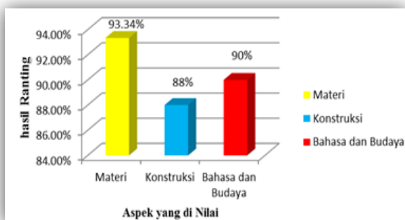
Gambar Grafik Hasil Validasi Butir Soal

Dari Gambar hasil validasi butir soal, diperoleh rata-rata hasil validasi pada aspek materi 93,34%, aspek kontruksi 80% dan aspek bahasa dan budaya 90%. Dari rata-rata validasi 3 (tiga) aspek tersebut dapat disimpulkan tingkat validitas butir soal sebesar 90,45%, dan dinyatakan sangat layak digunakan.