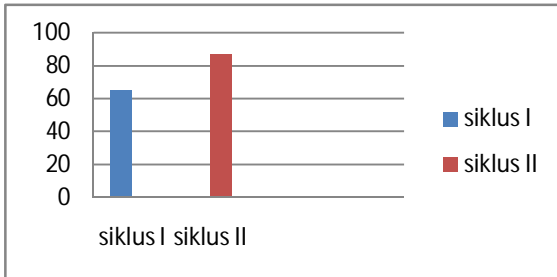
Diagram 4.1. Data Aktifitas Guru

Dari tabel hasil penelitian di atas, peneliti mengemukakan data yang telah ada sebagai berikut Data aktifitas guru selama proses pembelajaran matematika berlangsung pada siklus I dan siklus II