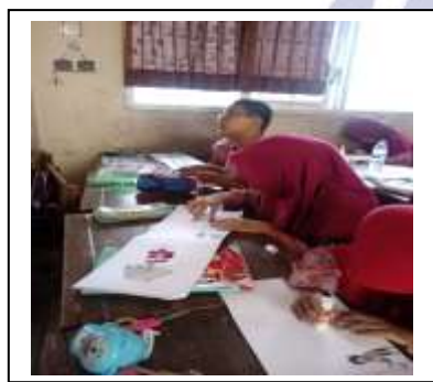
Gambar 3. Pembuatan buklet hak & kewajiban terhadap air dan tumbuhan.