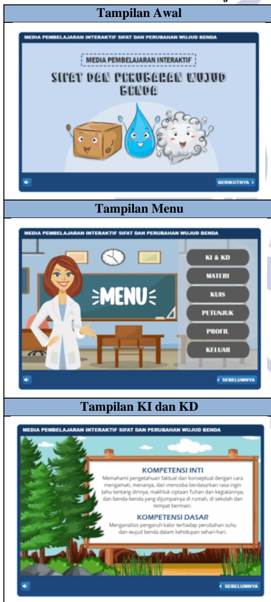
Tabel 4. Desain Media Pembelajaran

Software ini dipilih peneliti dikarenakan penggunaannya yang mudah dan tampilannya yang cukup menarik. Selain itu, output berupa html5 juga mudah diakses melalui browser pada smartphone maupun laptop . Selanjutnya materi yang dipilih yaitu sifat dan perubahan wujud benda. Media akan dibuat sesuai kebutuhan dengan materi yang disesuaikan. Langkah-langkah yang dilakukan oleh peneliti adalah sebagai berikut: (1) mencari literatur mengenai mata pelajaran IPA materi sifat dan perubahan wujud benda kelas V SD dari berbagai sumber, (2) mencari gambar yang relevan dengan materi, (3) membuat desain media dengan menggunakan software Articulate Storyline 3 . Berikut ini adalah desain media pembelajaran interaktif yang telah dibuat oleh peneliti: