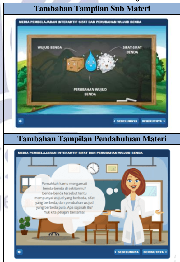
Tabel 5. Perbaikan Media Pembelajaran

Setelah media dan materi dinyatakan valid, media pembelajaran interaktif sifat dan perubahan wujud benda siap digunakan dalam uji coba. Penggunaan media ini cukup mudah karena dapat diakses melalui browser pada smartphone maupun laptop. Hal tersebut dikarenakan hasil output dari media pembelajaran interaktif sifat dan perubahan wujud benda adalah html5 .