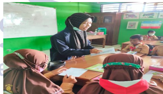
Gambar 2. Guru dan siswa menyiapkan peralatan dalam pembelajaran

(2) Planning : pada tahap ini siswa diminta untuk mempersiapkan alat yang digunakan dalam pembelajaran mulai dari alat tulis, buku dan kertas buffalo. Berikut adalah gambar siswa menyiapkan peralatan yang akan digunakan dalam belajar.