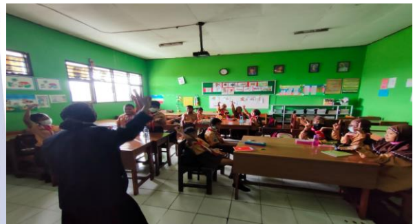
Gambar 1. Guru dan siswa mengeksplorasi tentang pecahan

sholat wajib ataupun sunnah, seperti sholat duha, sholat malam dan sholat lainnya. Upacara adat yang biasa dilakukan oleh masyarakat Jawa khususnya adalah masyarakat Jawa Timur yaitu upacara adat megegan. Upacara adat megegan biasanya dilakukan di masjid. Kue atau jajanan pasar yang identik dengan upacara adat megegan adalah kue apem. Kemudian siswa diminta untuk memotong \frac{1}{3} kue apem yang telah disediakan oleh guru menjadi \frac{1}{3} bagian. Berikut adalah gambar guru dan siswa mengeksplor tentang upacara megegan dikaitkan dengan pecahan. Lalu dilanjutkan dengan penjelasan tentang bentuk-bentuk pecahan