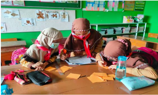
Gambar 3. Siswa membuat kartu pecahan dan berdiskusi menyelesaikan permasalahan yang ada dalam LKPD

gambar siswa sedang berdiskusi dan menyelesaikan permasalahan yang diberikan guru.