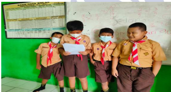
Gambar 4 . Siswa mengkomunikasikan hasil diskusi di depan kelas

(4) Communicating : pada tahap ini siswa mengkomunikasikan hasil kerja kelompok yang telah dilakukan. Berikut adalah gambar siswa menyampaikan hasil dari diskusi yang dilakukan.