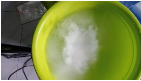
Gambar 2. Contoh eksperimen yang ada di video percobaan sederhana flashcard berbarcode

Video pembelajaran yang sudah dibuat baik dalam bentuk animasi maupun eksperimen diberi isi suara ( dubbing ) sesuai dengan penjelasan yang ada di tampilan video pembelajaran. Dalam proses editing akhir sekaligus penambahan dubbing , peneliti menggunakan aplikasi wondershare filmora . Video yang sudah selesai dibuat kemudian diupload di akun youtube peneliti dengan pengaturan hanya bisa diakses apabila mengakses kode barcode. Link video yang berisi video pembelajaran kemudian diubah menjadi kode barcode menggunakan aplikasi QR Code Scanner . Kode barcode yang sudah ada kemudian dimasukkan dan disesuaikan kedalam desain kartu flashcard berbarcode di aplikasi canva . Kartu flashcard berbarcode terdiri dari depan dan belakang, bagian depan kartu berisi judul dan gambar dan bagian belakang berisi kode barcode. Berikut merupakan hasil desain kartu flashcard berbarcode.