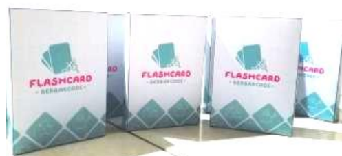
Gambar 3. Desain kemasan kartu flashcard berbarcode

Agar mudah dalam penyimpanan dan penggunaannya, peneliti membuat desain kemasan yang menarik dan aman. Desain kartu tersebut menggunakan aplikasi photoshop dan dicetak pada kertas duplex.