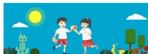
Gambar 1. Contoh tampilan video animasi flashcard berbarcode

Untuk video petunjuk eksperimen, peneliti melakukan pengambilan video secara langsung. Peneliti melakukan eksperimen menggunakan alat dan bahan sederhana kemudian merekam video tersebut. Kegiatan ini dilakukan untuk membantu siswa dalam memahami dan melakukan percobaan sederhana dengan mudah. Video petunjuk eksperimen yang dibuat oleh peneliti berjumlah 7 video yang terdiri dari petunjuk eksperimen pengaruh kalor terhadap perubahan suhu, mencair, membeku, menguap, mengembun, menyublim dan mengkristal. Pada bagian kartu latihan soal, peneliti menggunakan website wordwall . Latihan soal tersebut berupa pertanyaan yang dikemas dalam bentuk permainan.