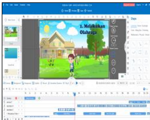
Gambar 1. Proses Pengembangan