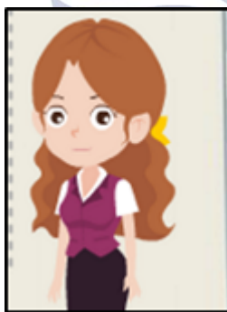
Gambar 2. Karakter Animasi