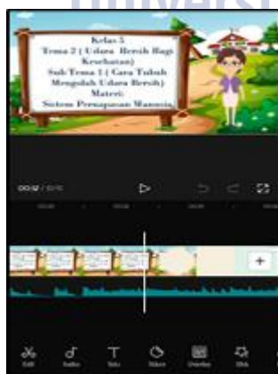
Gambar 4. Proses Render

Peneliti kemudian melakukan kegiatan validasi materi dan media. Media yang telah melakukan uji kelayakan akan dianggap layak digunakan. Uji.kelayakan (validasi) memiliki beberapa aspek yang harus dipenuhi pada media tersebut. Sebelum digunakan pada proses pembelajaran produk yang akan dikembangkan melalui kegiatan validasi. Hal tersebut bertujuan untuk menyempurnakan media yang sudah dikembangkan oleh peneliti. Validasi dilakukan oleh para ahli dibidangnya. Pada produk media ini validasi media dan materi dilakukan sekaligus oleh Farida Istianah, S.Pd., M.Pd selaku dosen PGSD Unesa. Berikutnya pada aspek validasi materi terdiri atas beberapa aspek antara lain aspek materi yang digunakan, aspek isi tampilan media, dan aspek kelayakan media sebagai penunjang proses pembelajaran dan dikembangkan menjadi 13 pertanyaan. Hasil tersebut dibawah ini: