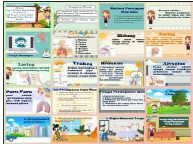
Gambar 5. Video Animasi

menjadi menarik. Animasi yang telah dikembangkan dengan menggunakan aplikasi Animiz Animation Maker . Selanjutnya digabungkan menjadi satu menggunakan aplikasi CapCut . Aplikasi CapCut yaitu perangkat lunak yang berfungsi sebagai editing video dan bisa diunduh melalui handphone . Backsound serta audio juga ditambah dengan aplikasi yang sama. Backsound music digunakan untuk membuat video animasi lebih menarik. Proses selanjutnya yaitu mengembangkan video menjadi satu dengan proses render sebagai hasil akhir pembuatan video. Kemudian, produk telah siap digunakan, setelah itu melakukan tahap pengujian sebelum digunakan pada proses pembelajaran.