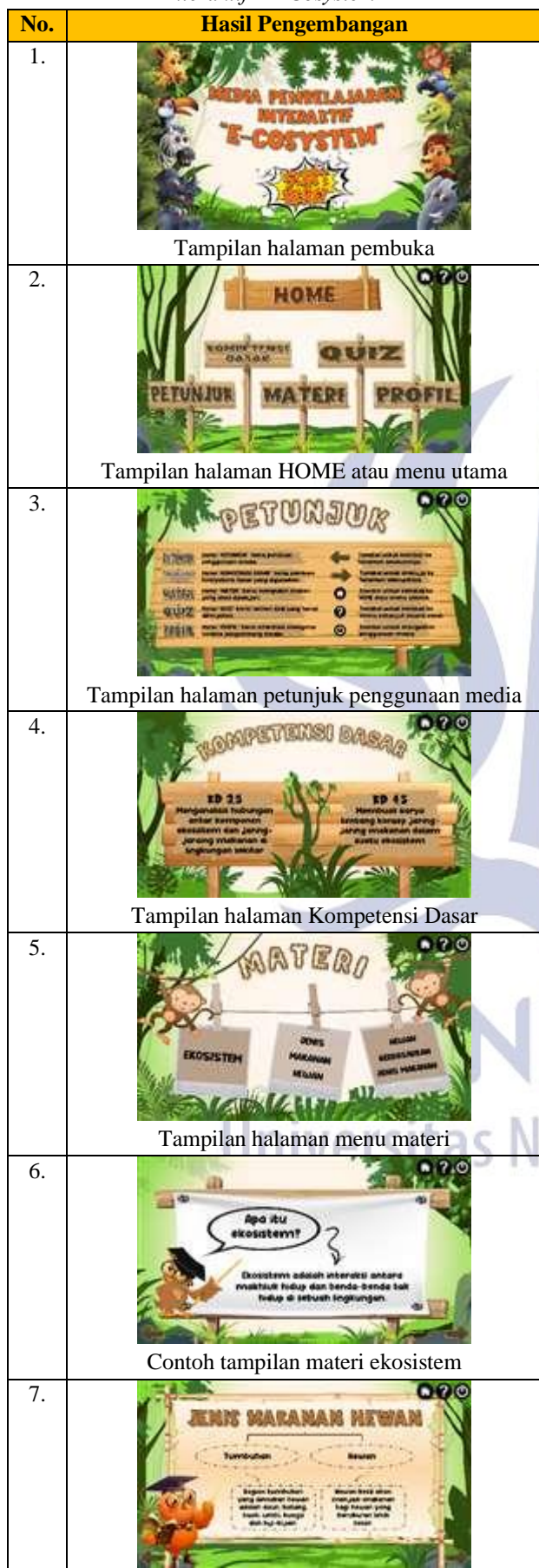
Tabel 5. Hasil Pengembangan Media Pembelajaran Interaktif “E-Cosystem”