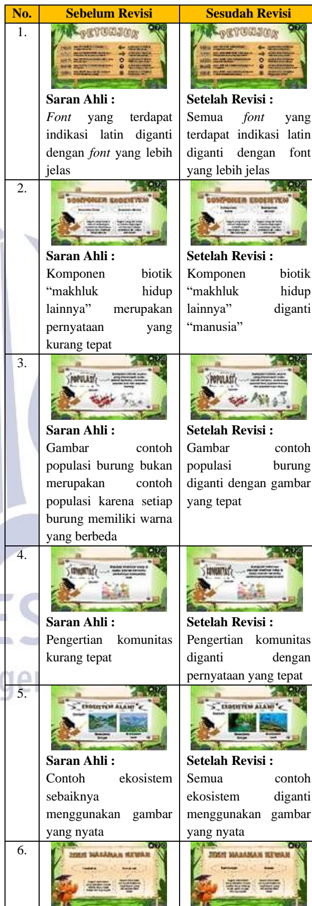
Tabel 8. Hasil Revisi Media

Berdasarkan validasi tersebut, media pembelajaran interaktif “E-cosystem” telah diperbaiki sesuai saran dan masukan dari para ahli sebagai berikut.