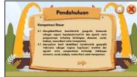
Gambar 7. Halaman Pendahuluan