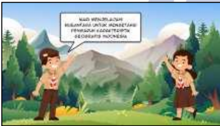
Gambar 2. Halaman Pembuka