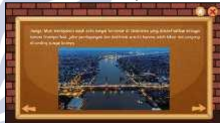
Gambar 9. Tampilan Materi Setiap Pulau