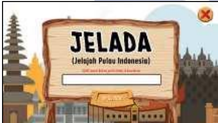
Gambar 3. Tampilan sebelum memulai