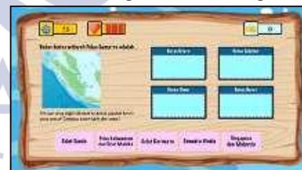
Gambar 10. Tampilan Games Setiap Pulau