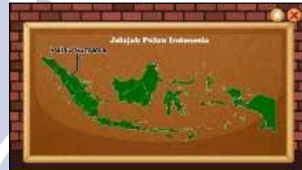
Gambar 8. Peta Jelajah Indonesia