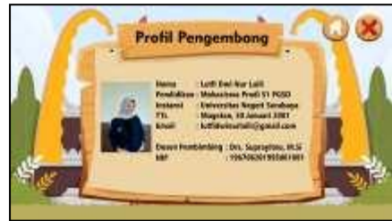
Gambar 6. Profil Pengembang