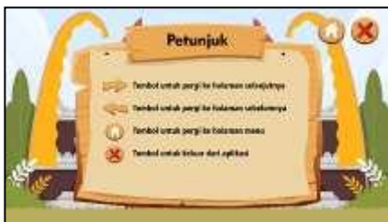
Gambar 5. Petunjuk