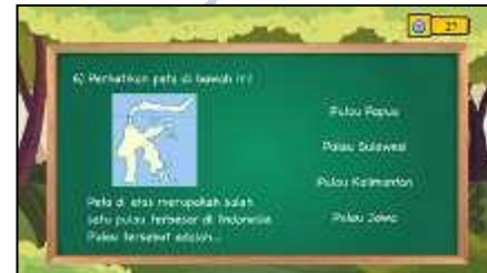
Gambar 11. Tampilan Kuis