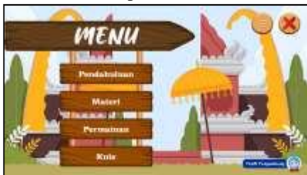
Gambar 4. Halaman Menu Utama