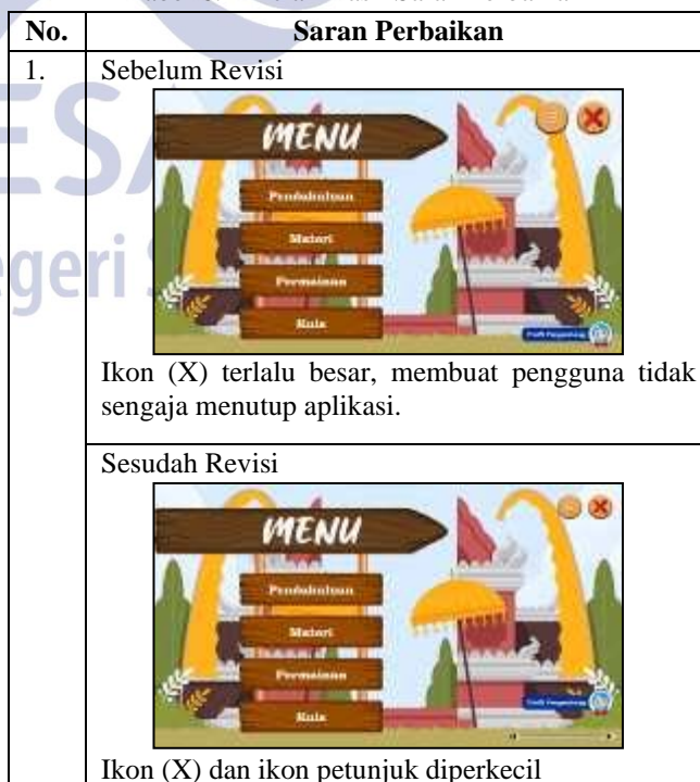
Tabel 6. Rincian Hasil Saran Perbaikan

Terdapat beberapa saran perbaikan dari ahli materi dan ahli media yang diuraikan pada tabel di bawah: