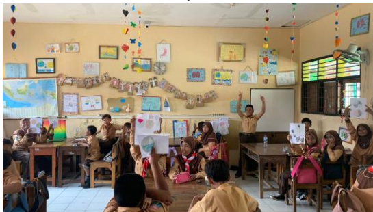
Gambar 6 Penyebaran Media

Setelah media disebarluaskan, untuk mengetahui respon peserta didik maka peneliti membagikan angket kepada mereka untuk diuji keberhasilan dari media pembelajaran yang dikembangkan. Peserta didik diberi angket dengan beberapa indikator penilaian di dalamnya, skor yang terdapat di dalam angket menggunakan skala likert 1 sampai dengan 4 dengan ketentuan yang sama. Berdasarkan data hasil respon peserta didik, media LKPD Elektronik yang dikembangkan peneliti mendapat respon