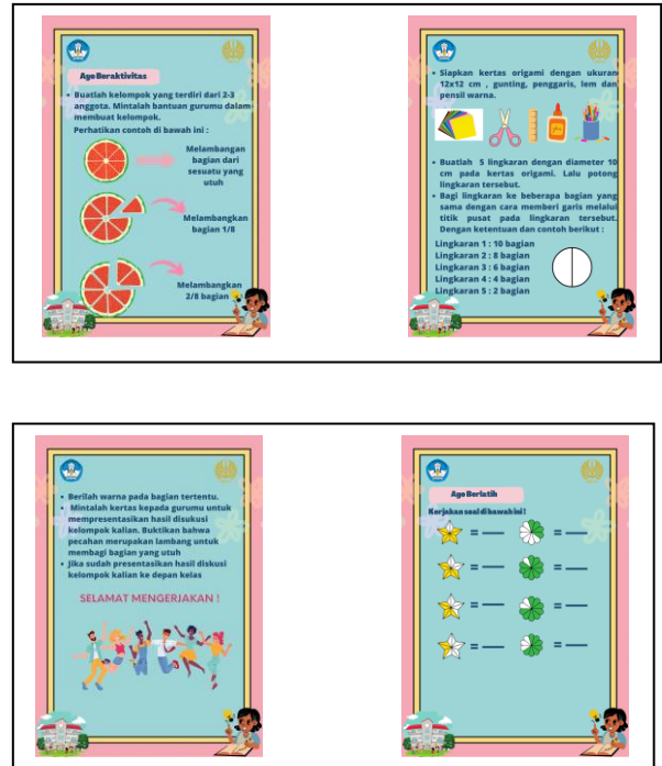
Gambar 5 Aktivitas Peserta Didik