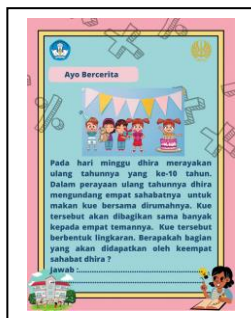
Gambar 4 Implementasi PBL