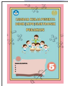
Gambar 3 Cover LKPD

Lembar Kerja Peserta Didik (LKPD) yang dikembangkan terdiri dari dua bagian, yaitu bagian pendahuluan dan bagian isi. Bagian pendahuluan meliputi cover, tujuan pembelajaran, dan petunjuk kegiatan. Bagian isi meliputi ayo bercerita, ayo beraktivitas, ayo berlatih dan mari menyimpulkan.