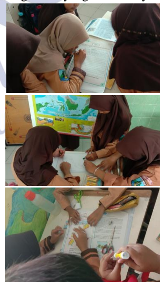
Gambar 3. Proses peserta didik mengerjakan tugas sesuai gaya belajar

Selanjutnya sintaks tahap kedua yakni berpikir, siswa bersama guru diberikan soal pada kegiatan 1 dan melaksanakan tanya jawab mengenai letak geografis Indonesia. Sintaks tahap ketiga yakni berpasangan, siswa secara berkelompok mendiskusikan dan menjawab pertanyaan. Sintaks keempat yakni berbagi, guru memberi tugas yang berbeda sesuai kelompok pada kegiatan kedua untuk diselesaikan secara berkelompok dan kegiatan ini termasuk pada diferensiasi proses. Berdasarkan observasi peneliti, siswa dibagi menjadi 7 kelompok berdasarkan diferensiasi proses yang dilaksanakan oleh guru yakni kelompok Audio (A1, A2, dan A3), Visual (V1 dan V2) dan Kinestetik (K1 dan K2). Pengelompokan ini berdasarkan pemetaan gaya belajar peserta didik yang sudah dilaksanakan melalui asesmen diagnostic. Kelompok Audio (A1, A2, dan A3) diberikan tugas untuk membuat teks bacaan mengenai kondisi dan letak geografis Indonesia. Untuk kelompok Visual (V1 dan V2) diberikan tugas menggambar dan mewarnai peta Indonesia. Lalu kelompok Kinestetik (K1 dan K2) diberikan tugas untuk menyusun puzzle dengan memotong dan menempelkan gambar yang sebelumnya diacak