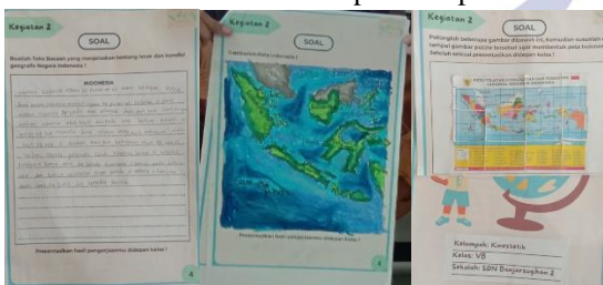
Gambar 4. Hasil produk peserta didik sesuai gaya belajar

untuk menghasilkan produk yang sesuai dengan tujuan pembelajaran dan proses yang telah dilaksanakan selama pembelajaran. Kelompok A1,A2, dan A3 menghasilkan produk berupa teks bacaan seputar kondisi dan letak geografis Indonesia. Kemudian kelompok V1 dan V2 menghasilkan produk berupa gambar peta Indonesia. Lalu kelompok K1 dan K2 menghasilkan produk berupa Peta Indonesia. Setelah semua kelompok selesai mengerjakan semua tugasnya di LKPD, maka setiap kelompok mempresentasikan hasil pengerjaannya di depan kelas. Kemudian masuk pada sintaks tahap kelima yakni penghargaan, siswa diberikan penghargaan sebab berani mengejakan tugas dengan baik dan mempresentasikan dengan percaya diri. Kegiatan pembelajaran berdiferensiasi ini memenuhi 6 indikator keterampilan berpikir kritis.