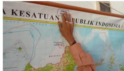
Gambar 2. Sumber belajar berupa bermain dengan media konkret peta Indonesia

Selanjutnya sintaks tahap kedua yakni berpikir, siswa bersama guru diberikan soal pada kegiatan 1 dan melaksanakan tanya jawab mengenai letak geografis Indonesia. Sintaks tahap ketiga yakni berpasangan, siswa secara berkelompok mendiskusikan dan menjawab pertanyaan. Sintaks keempat yakni berbagi, guru memberi tugas yang berbeda sesuai kelompok pada kegiatan kedua untuk diselesaikan secara berkelompok dan kegiatan ini termasuk pada diferensiasi proses. Berdasarkan observasi peneliti, siswa dibagi menjadi 7 kelompok berdasarkan diferensiasi proses yang dilaksanakan oleh guru yakni kelompok Audio (A1, A2, dan A3), Visual (V1 dan V2) dan Kinestetik (K1 dan K2). Pengelompokan ini berdasarkan pemetaan gaya belajar peserta didik yang sudah dilaksanakan melalui asesmen diagnostic. Kelompok Audio (A1, A2, dan A3) diberikan tugas untuk membuat teks bacaan mengenai kondisi dan letak geografis Indonesia. Untuk kelompok Visual (V1 dan V2) diberikan tugas menggambar dan mewarnai peta Indonesia. Lalu kelompok Kinestetik (K1 dan K2) diberikan tugas untuk menyusun puzzle dengan memotong dan menempelkan gambar yang sebelumnya diacak