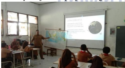
Gambar 1. Sumber belajar berupa video pembelajaran yang terdapat gambar dan lagu