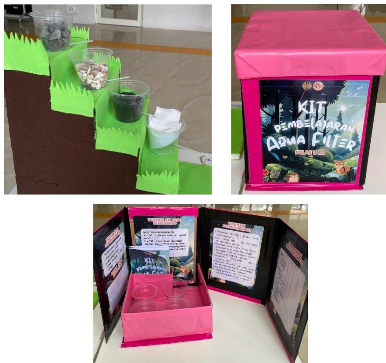
Gambar 2. Tampilan Media Aqua Filter dan KIT Aqua Filter

menuntut siswa dalam menganalisis dan pengambilan keputusan. Media yang dirancang secara aktif dan partisipatif terbukti mampu meningkatkan keterlibatan kognitif siswa dalam proses belajar (Hasan et al., 2021).