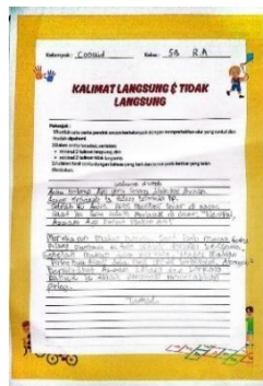
Gambar 2. Produk Kelompok Siap

Gambar di atas merupakan produk penugasan dari menyebutkan contoh kalimat langsung dan tidak langsung pada kelompok belajar kurang siap.