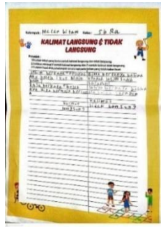
Gambar 1. Produk Kelompok Kurang Siap

Gambar di atas merupakan produk penugasan dari menyebutkan contoh kalimat langsung dan tidak langsung pada kelompok belajar kurang siap.