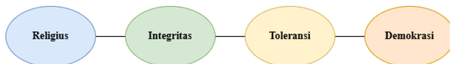
Gambar 2. 4 Nilai Utama

Program Parent Teaching di SD Muhammadiyah 1 Sidoarjo terbukti menjadi sarana pengembangan karakter yang komprehensif. Melalui interaksi dengan orang tua pengajar, siswa menginternalisasi empat nilai utama yang bersifat dinamis dan kontekstual untuk menuju pendidikan berkualitas, yakni nilai religius, integritas, toleransi, dan demokrasi.