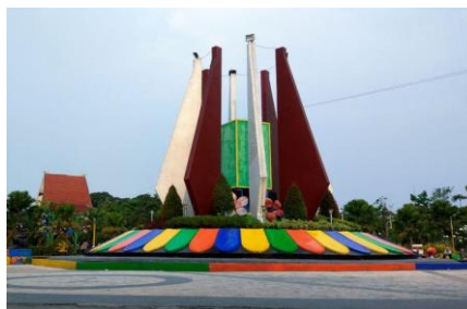
Gambar 1. Gambar Alun-alun Kota Mojokerto Tempo Dulu

pejabat kabupaten yang diangkat oleh Belanda, biasa dikenal dengan nama Recomba. Tugu peringatan itu kemudian dinamakan tugu proklamasi. Dinamakan demikian karena pada tugu itu terdapat teks proklamasi yang ditulis pada lempengan marmer. Teks itulah yang sekarang tertempel pada sisi selatan tugu. Pembuatan tugu itu sepertinya tanpa rencana dan desain yang baik. Masalah pembangunan belum terpikirkan, apalagi anggaran juga tidak ada atau belum sempat membahas anggaran dan belanja sehingga tidak heran bila bentuk tugu itu teramat sederhana. Hal tersebut dapat dilihat pada bentuk visual tugu yang ditampilkan pada Gambar 1.