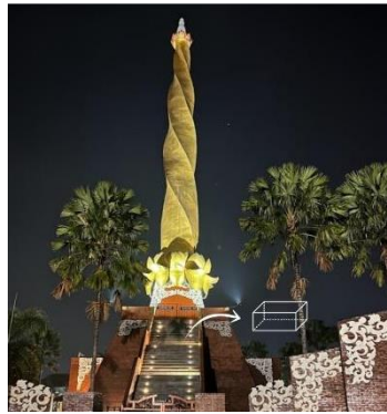
Gambar 5. Bangun Balok yang Terdapat pada Tangga Tugu Lingga Yoni

Hasil studi peneliti pada bangunan alun-alun kota Mojokerto masa kini terdapat aplikasi konsep matematika yakni konsep geometri bangun ruang. Pada bangunan alun-alun kota Mojokerto masa kini terdapat tiga bagian bangunan yakni pedestal atau dudukan tugu, tubuh tugu, dan puncak tugu. Pada bangunan alun-alun masa kini juga terdapat tiga bangun ruang, yakni balok, tabung, dan kerucut. Balok adalah bangun ruang yang dibatasi oleh enam buah bidang sisi yang masing-masing berbentuk persegi panjang yang setiap sepasang-sepasang sejajar dan sama ukurannya. Bangun ruang berbentuk balok terdapat pada bangunan pedestal atau dudukan tugu seperti yang dapat dilihat melalui gambar dibawah ini.