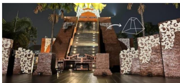
Gambar 8. Bentuk Prisma Trapesium pada Pedestal atau Dudukan Tugu Lingga Yoni

Sedangkan bentuk prisma trapesium terletak pada pedestal atau dudukan tugu lingga yoni. Bangun Prisma trapesium adalah bangun datar 3D yang mempunyai penampang trapesium pada satu arah dan penampang persegi panjang pada arah lainnya yang berarti prisma tersebut mempunyai dua trapesium kongruen yang dihubungkan satu sama lain dengan empat persegi panjang. Trapesium kongruen ini berada di bagian atas dan bawah prisma yang disebut alas. Keempat persegi panjang tersebut disebut sisi-sisi lateral prisma trapesium. Bangun ruang prisma trapesium ini juga merupakan bangun ruang yang belum ada di monumen alun-alun kota Mojokerto tempo dulu, sehingga ini merupakan bangun ruang pembeda antara monumen tempo dulu dan sekarang seperti yang bis akita lihat pada gambar di bawah ini.