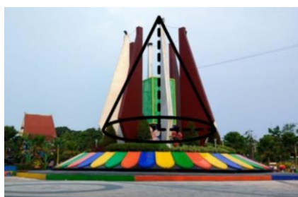
Gambar 4. Gambar Bangun Kerucut yang Terdapat Pada Tugu Bunga Teratai

Sedangkan bangun ruang kerucut terdapat pada tugu yang berbentuk bunga Teratai. Kerucut merupakan bangun ruang yang dibatasi oleh sebuah sisi lengkung dan sebuah sisi alas berbentuk lingkaran seperti pada gambar berikut.