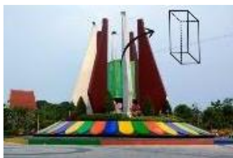
Gambar 3. Bangun Balok yang Terdapat pada Tugu Kaca Pengilon

Bangun ruang berbentuk balok terdapat pada bangunan tugu kaca pengilon. Balok adalah bangun ruang yang dibatasi oleh enam buah bidang sisi yang masing-masing berbentuk persegi panjang yang setiap sepasang-sepasang sejajar dan sama ukurannya seperti yang ditunjukkan pada gambar di bawah ini.