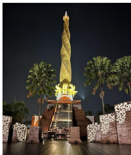
Gambar 2. Gambar Alun-alun Kota Mojokerto Masa Kini

Bentuk menara adalah Lingga Yoni yang melambangkan kesuburan wilayah. Konsep lingga yoni ini banyak dipakai pada masa Majapahit dan kemudian diadopsi oleh Presiden Soekarno saat merancang Tugu Monumen Nasional (Monas). Pada puncak tugu terdapat bunga teratai atau Padma dalam posisi mekar yang menunjukkan puncak pencapaian spiritual atau hubungan vertikal antara manusia dengan Sang Pencipta. Sedangkan bunga Padma atau teratai posisi kuncup ke atas melambangkan kekuatan ruhaniah. Tubuh tugu berbentuk pilinan. Bentuk tersebut melambangkan perjalanan hidup yang dinamis dengan cita-cita kuat. Bentuk tugu yang kokoh menunjukkan kekuatan jasmaniah. Pedestal atau dudukan tugu mengambil bentuk dari Candi Sukuh yang merupakan salah satu bangunan masa Majapahit yang terbuat dari material batu andesit. Pedestal tugu tersebut dimaksudkan untuk menunjukkan keragaman bentuk bangunan dan material masa Majapahit yang tidak hanya menggunakan batu bata saja.