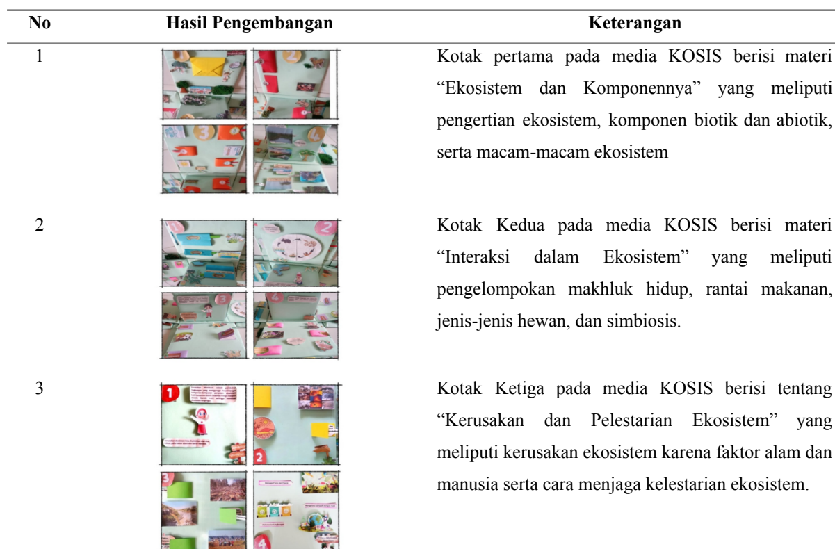
Tabel 1. Pengembangan Media KOSIS

Pengembangan media pembelajaran KOSIS dilakukan dengan memanfaatkan benda-benda sederhana yang ada di lingkungan sekitar seperti kardus, kertas manila, serta origami. Media KOSIS terdiri dari tiga kotak dengan masing-masing kotak terdapat tambahan video dan juga game interaktif.