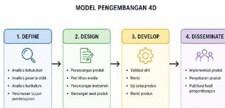
Gambar 1. Model Pengembangan 4D

Model ini memungkinkan pengembangan program yang sistematis serta dapat disesuaikan dengan kebutuhan dan profil peserta didik (Witari, 2022). Dengan demikian, penelitian ini memiliki kebaruan dalam bentuk pengembangan program literasi yang tidak terbatas pada pembiasaan membaca, tetapi juga mengintegrasikan pemahaman melalui kegiatan menulis secara berkelanjutan. Berdasarkan uraian tersebut, penelitian ini bertujuan untuk meninjau pelaksanaan, efektivitas, dan pengaruh program untuk mengembangkan dan menguji program “SAPA AKU”. Metode ini dipilih karena relevan dalam menghasilkan produk berupa program yang bersifat berkelanjutan serta dapat diimplementasikan di lingkungan sekolah (Fayrus et al., 2022). Penelitian dilaksanakan di SDI Bahrul Ulum Surabaya dengan subjek penelitian peserta didik kelas V. Pemilihan subjek didasarkan pada kebutuhan sekolah dalam meningkatkan minat baca peserta didik serta sebagai kelas percontohan dalam penerapan program literasi.