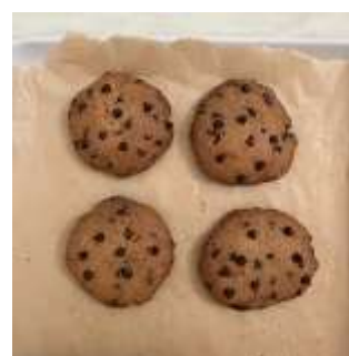
(A) 316 10%:90%