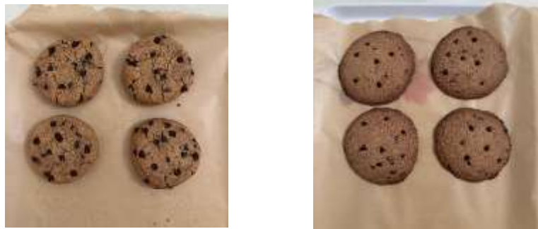
Gambar 2. Hasil produk soft cookies komposit tepung cangkang telur ayam