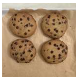
(K) 242 0%:100%