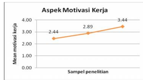
Gambar 3. Grafik mean motivasi kerja (data primer, 2013)

Nilai korelasi untuk pengalaman kerja dan pendapatan usaha adalah 0,551 yang menunjukkan bahwa hubungan antara keduanya juga bersifat positif dan signifikan. Nilai signifikan yang ditunjukkan oleh pengalaman kerja sebesar 0,001 yang lebih kecil dibandingkan taraf signifikan, sehingga dapat disimpulkan bahwa pengalaman kerja memiliki hubungan linier yang signifikan dengan pendapatan usaha. Hasil penelitian berarti jika pengalaman kerja naik maka pendapatan usaha juga ikut naik.