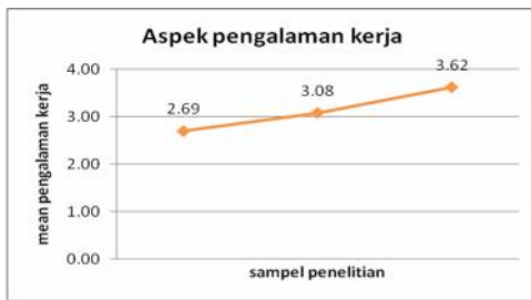
Gambar 2. Grafik mean pengalaman kerja (data primer, 2013)