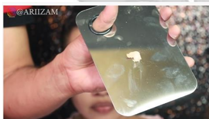
Gambar 2 Takaran foundation creamy Naturacor shade 151 1 scup

Menurut Ari Izam makeup artis ternama, beauty vlogger serta penulis dari buku “The Secret of MUA” dan juga salah satu MUA Indonesia yang sudah memiliki Produk sendiri yang bernama “Ari Izam Gel alis Viral” menyatakan bahwa Jenis foundation yang digunakan untuk mixing agar menghasilkan hasil riasan yang tahan lama lebih dari 5 jam setelah pemakaian yaitu dengan mixing foundation dan kosmetik lainnya, yaitu foundation creamy Naturacor shade 151 : foundation liquid Nars shade Barcelona : Concealer Makeup forever ultra HD shade R20 : Aqua sel Makeup Forever dengan takaran 1 scup : 3 pump : 1 tetes : 2 tetes .