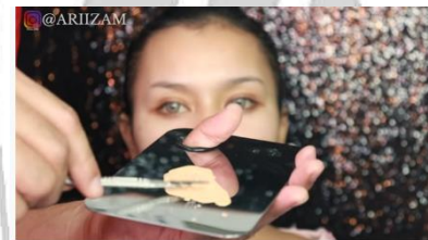
Gambar 6 Cara Mixing Foundation